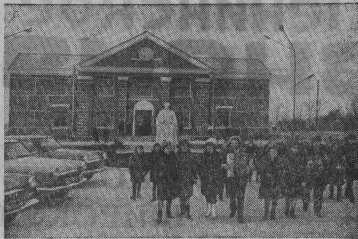
Вольнская область. В селе Колодяжне Ковельского района гостеприимно распахнул двери Дом культуры.

Создается такое впечатление, что совхоз держится, если можно так выразиться, на административных костылях. И, очевидно, не случайно там «горит» квартальный план по производству молока и яиц. Надой в совхозе меньше чем четыре литра на корову (самые низкие в районе), а яиц только за последнюю декаду там недополучено три тысячи штук. Этого бы наверняка не случилось, если бы каждый коммунист совхоза был действительно активным бойцом партии, словом и делом ратовал бы за производство, за повышение боеспособности своей партийной организации, за деловитость каждого коммуниста. П. БОДУНОВ.