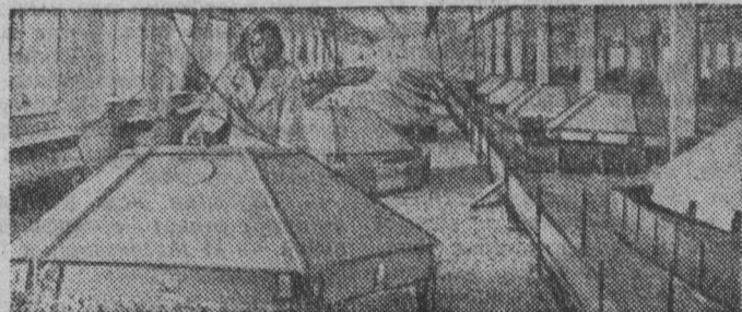
Красноярский край. Березовская бройлерная фабрика — передовое предприятие Сибири. За три года здесь на 78 процентов выросла производительность труда.