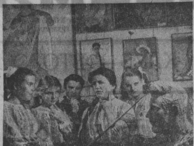
И. Е. Репина. Они подарили сельскому музею около 200 картин и скульптур.