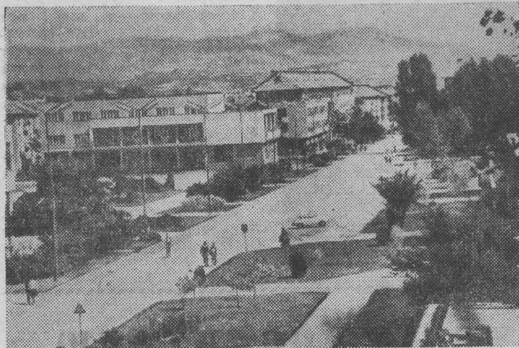
Иллюстрация к «американскому образу жизни»