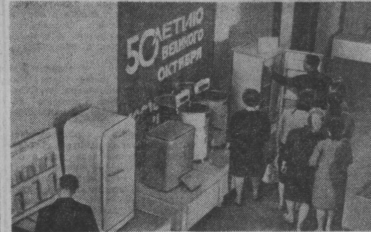
В Челябинске открыта выставка товаров народного потребления. На снимке: в отделе холодильников, стиральных машин, мебели.