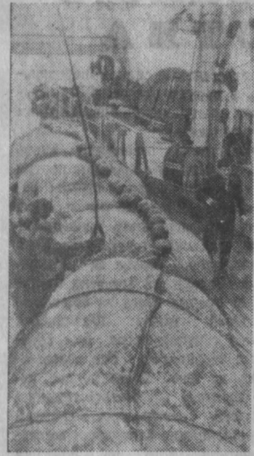
От Владивостока до Калининграда могли бы вытиснуть бочки с годовым уловом дальневосточных судов и флотилий. На снимке: выборка трала с богатим уловом морского окуша на морозильном траулере «Николай Островский», первом в стране, удостоенном звания красноразличенного.