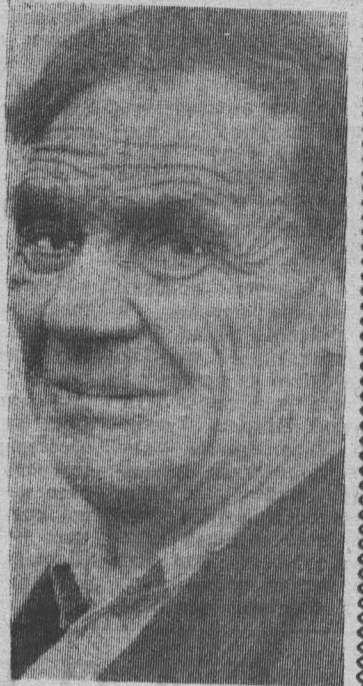
Фото и текст Б. ГУЛИШЕВСКОГО.