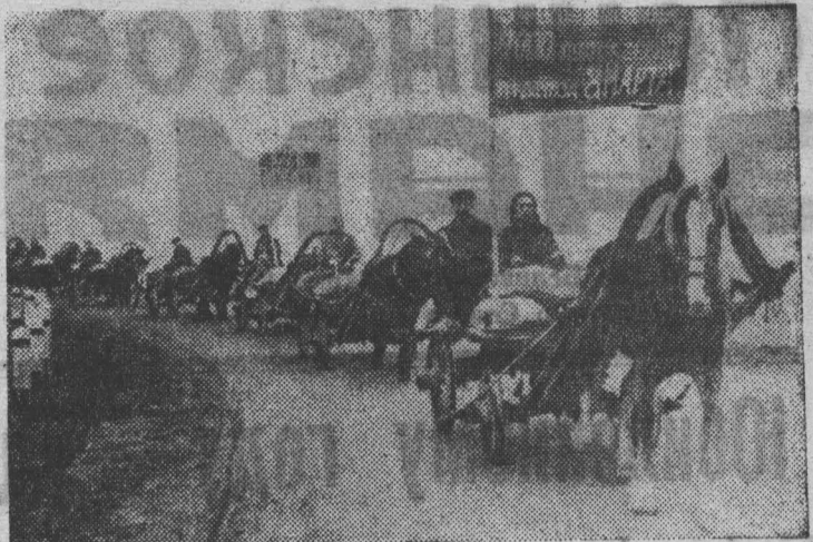
1944 год. Ярославская обл. Хлеб — фронту.

Организатором и вдохновителем победы в этой войне была ленинская партия коммунистов. В трудные суровые военные годы партия без устали сплачивала народ, звала его к великой цели — победе над фашизмом. И эта великая цель рождала великую энергию на фронте и в тылу. Советские люди сделали все, чтобы победить сильного и коварного врага. Мы с честью выдержали суровые испытания войны.