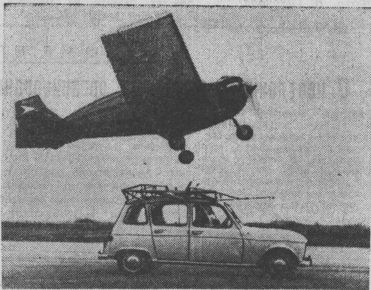
На снимке: самолет садится на автомашину.