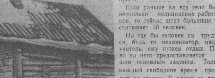
Был такой дом...

Если раньше на все село было несколько медицинских работников, то сейчас штат больницы насчитывает 30 человек.