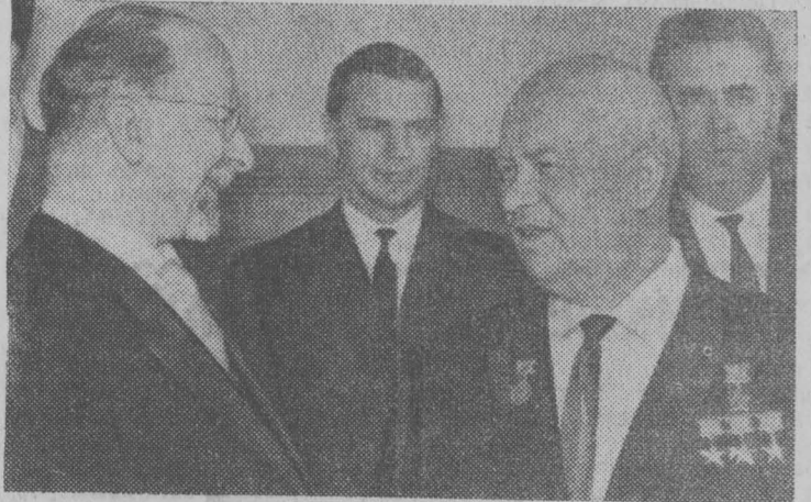
МОСКВА. Беседа Первого секретаря ЦК СЕПГ, Председателя Государственного совета ГДР Вальтера Ульбрихта и Первого секретаря ЦК КПСС, Председателя Совета Министров СССР Н. С. Хрущева.