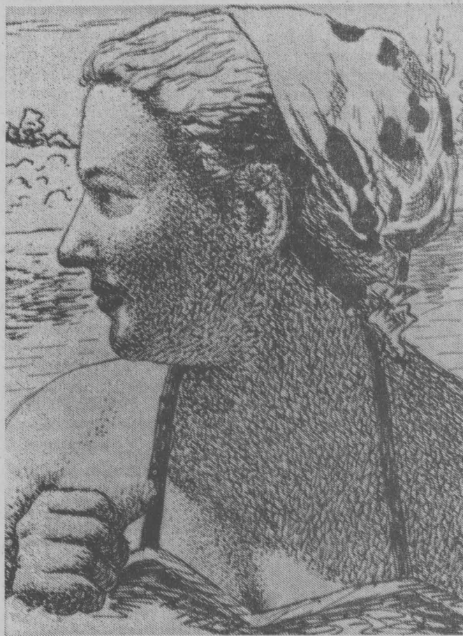
В ЛЕТНИЙ ДЕНЬ.