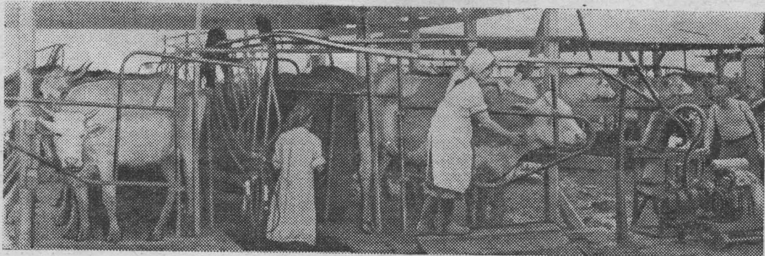
АМУРСКАЯ ОБЛАСТЬ. Колхоз «Приамурье». На механизированной доильной площадке колхоза. Техника избавила доярок от тяжелого ручного труда.

АДРЕС РЕДАКЦИИ: г. Белово, улица Тельмана, дом № 1. Телефоны: редактора — 4-03, отдела партийной жизни, ответственного секретаря — 2-25, отдела сельского хозяйства и отдела культуры — 4-02, бухгалтерии — 4-44.