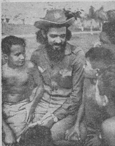
Республика Куба. Школьный учитель в деревне Канат (Сьерра-Маэстра). Есть о чем рассказать ученикам сражавшемуся в горах бородачу-партизану.

Но ярче солнца сверкают на улицах Гаваны революционные лозунги, и никакие дожди не могут смыть пламенные призывы к простому человеку — труженнику Кубы: множить успехи в труде, обороне и просвещении, еще шире развернуть социалистическое соревнование. Это соревнование становится все более могучим символом современной революционной Кубы, твердо идущей по пути строительства социализма. Кубинскую революцию делают