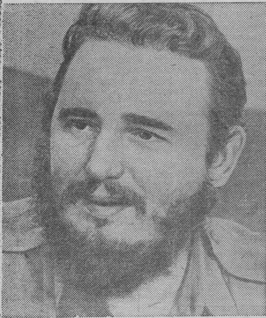
Премьер-министр Революционного правительства Республики Куба Фидель Кастро Рус.

Солнечный май гуляет по старинным и молодым улицам Гаваны. Ласково бьет море о камни у Малекона—набережной столицы Кубы. Воздух ото дня ко дню становится все более горячим и влажным, особенно в узких улочках старого города, у древнего испанского собора—приближается кубинское лето, или, точнее, дождливый сезон, так как на Кубе всего два времени года: сухое и дождливое.