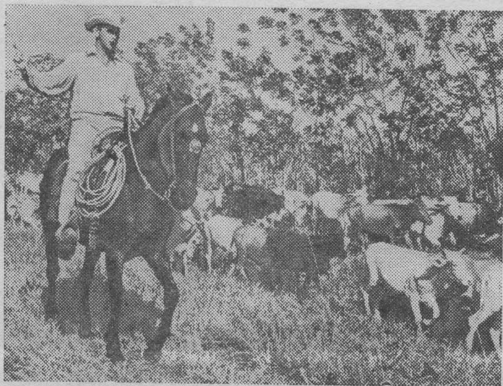
Республика Куба. Государственное животноводческое имение в провинции Камагуэй. Возвращение с пастбища.

Рабочий класс много сделал, чтобы Куба стала такой, как сегодня. На пути к этому — кровь Хесуса Менендеса, Араселио Иглесиоса, портовиков, погибших