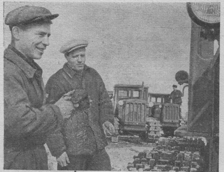
БУРЯТСКАЯ АССР. Десятки механизированных звеньев Мухоршибирского производственного управления вышли на поля. Первыми начали весенние работы, досрочно завершив ремонт техники, труженики сельхозартели «Коммунизм».

Председатель Президиума Верховного Совета РСФСР Н. ИГНАТОВ. Секретарь Президиума Верховного Совета РСФСР С. ОРЛОВ. Москва, 6 мая 1963 года.