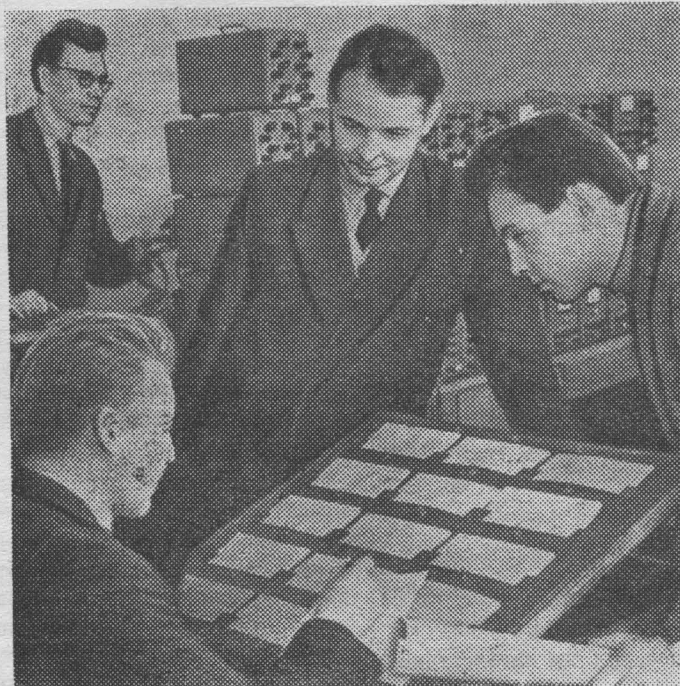
СВЕРДЛОВСК. В Уральском политехническом институте, на кафедре вычислительной техники, создано опытное электромеханическое устройство, которое может... принимать у студентов зачет.