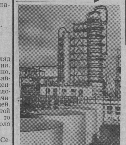
НА СНИМКЕ: дистилляционные установки.

После подписания соглашения между правительством Франции и временным правительством Алжира о прекращении военных действий в Алжире и самоопределении этого государства генеральной секретарь Французской коммунистической партии Морис Торез сказал, что «прекращение огня в Алжире еще не является миром». Он призвал народы Франции и Алжира к «величайшей бдительности». Последующие события в Алжире подтвердили своевременность этого призыва. Желая сорвать соглашение, открывающее путь к мирному урегулированию в Алжире, фашистские банды ОАС перешли от отдельных террористических актов к открытым военным действиям против французских войск и властей. В течение нескольких дней в городах Ал-