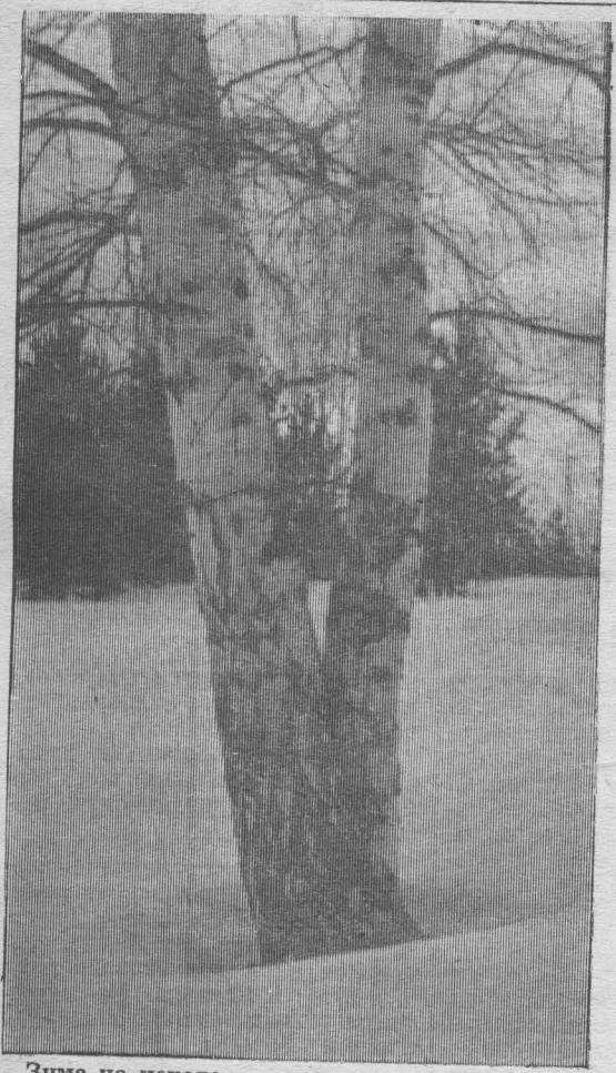
Зима на исходе.