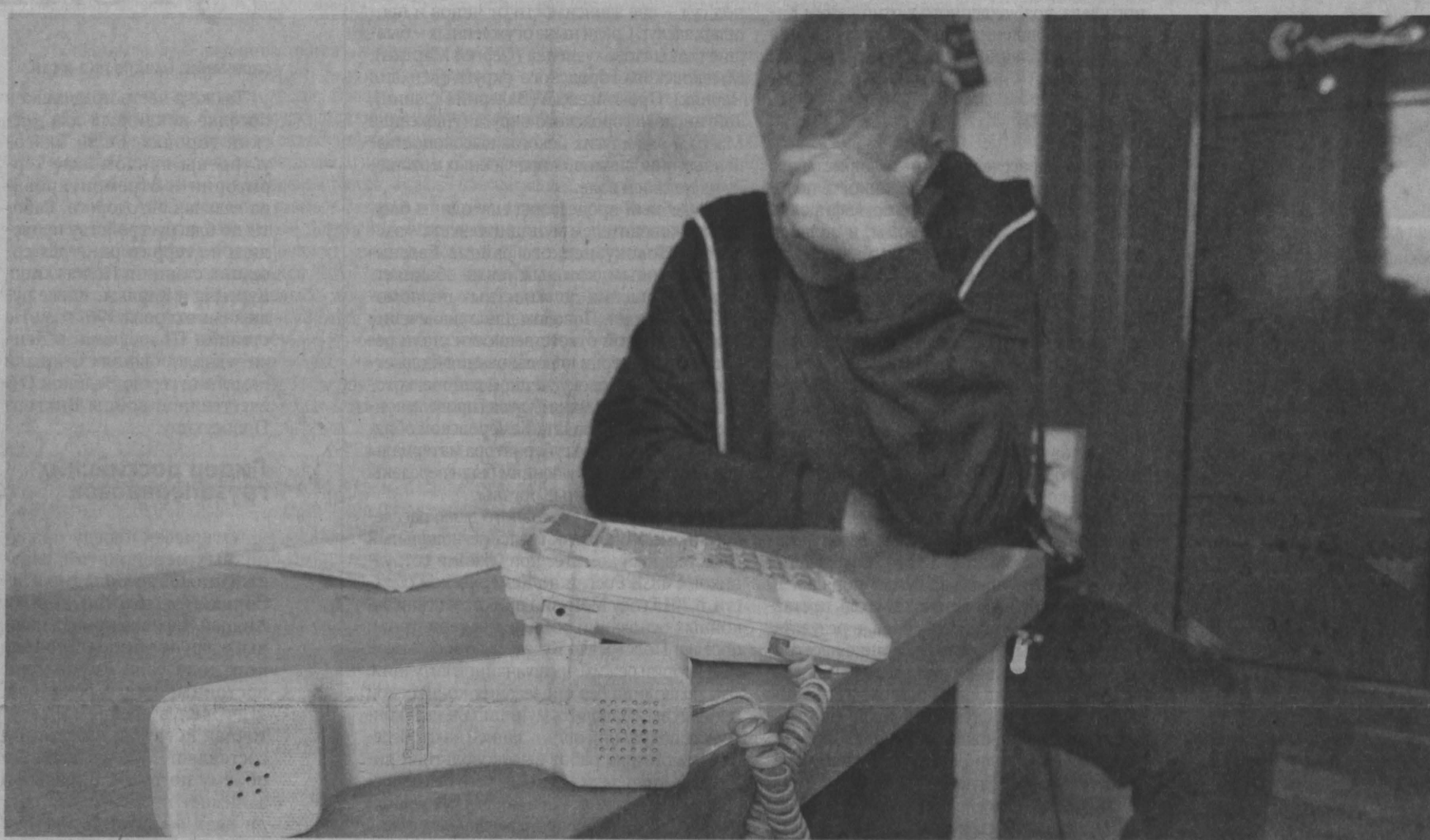
Закон жестко регламентирует деятельность коллекторов, включая количество разрешенных звонков должнику в течение дня или месяца.

Что сдерживает работу закона, призванного защитить должников от недобросовестных коллекторов?