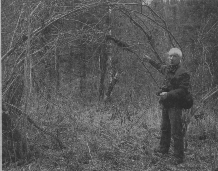
Кузбасс, красивая арка, сплетенная йети из нескольких рябин...

– И особенно впечатлило то, как свидетели описывали не стареющего одинокого монстра, – продолжает Фокин. – Рассказывали, как видели целые семьи йети... Вятский