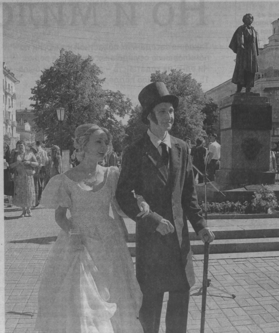
ДЕНЬ НАШЕГО ВСЕГО. Вчера в Кемерове на площади Пушкина прошел праздник, посвященный Пушкинскому дню России. Он отмечается с 1998 года на основании Указа президента РФ от 21.05.97 «О 200-летию со дня рождения А.С. Пушкина и установлении Пушкинского дня России». Все желающие могли принять участие в поэтическом марафоне и прочитать свое любимое стихотворение поэта. В финале прошел поэтический флешмоб, в ходе которого участники декламировали выступление и поэму «Руслан и Людмила» – «У Лукоморья дуб зеленый». А в Музыкальном театре Кузбасса им. А.Борова гостей ждало театрализованное представление «День рождения Пушкина».