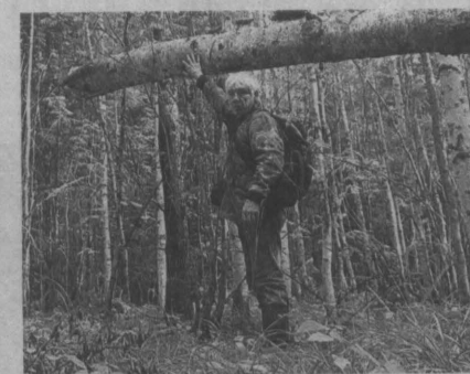
Наши йети развитей вятских