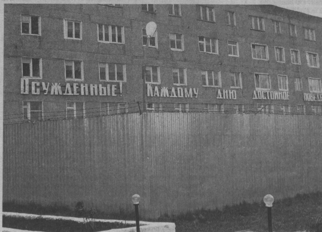
Здесь тоже жизнь...

ко — математик по первому образованию, кандидат педагогических наук — для этого заседания комиссии составил «коллективный портрет» ходатайствующих. И так, из 15