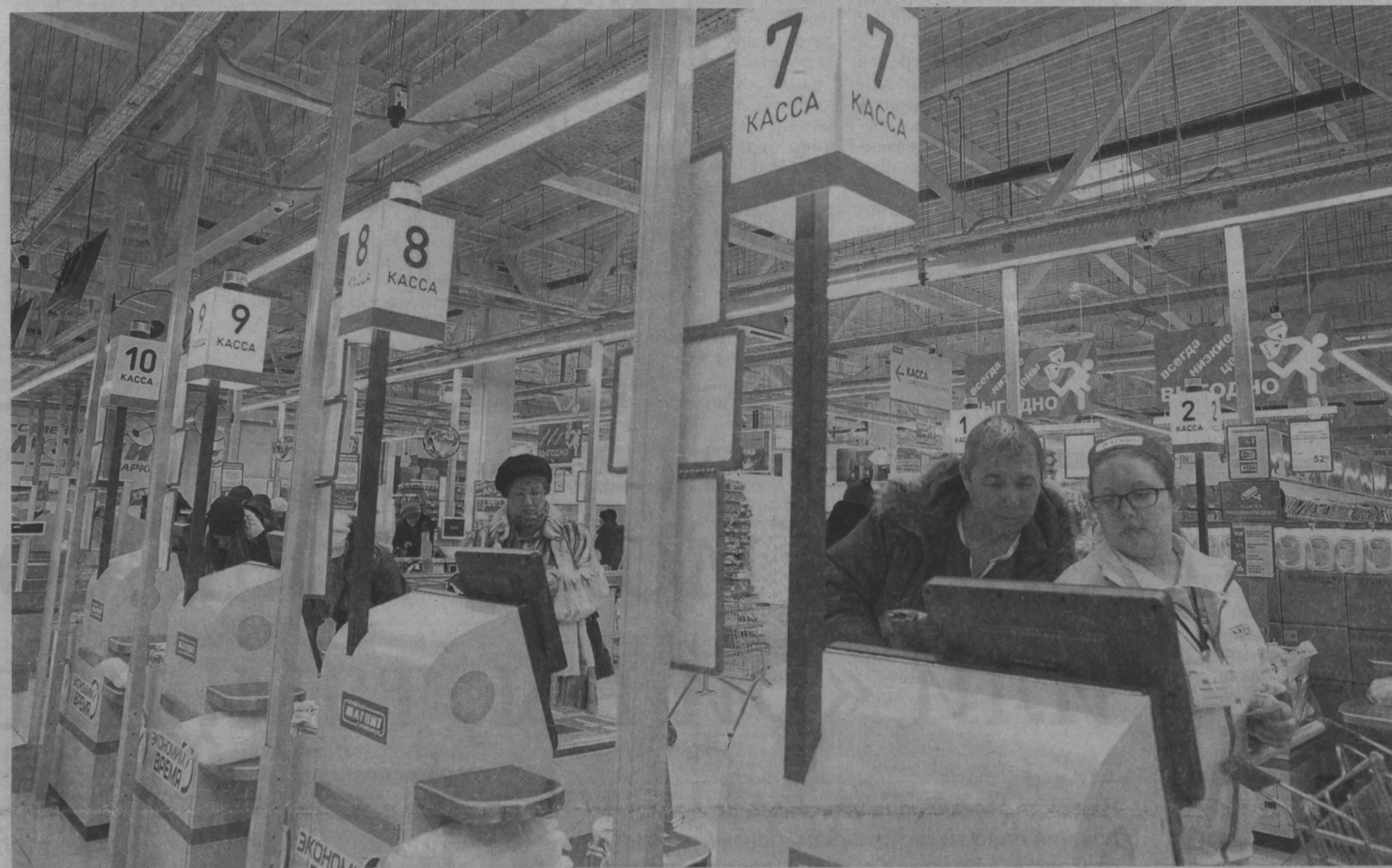
Федеральные сети привносят новое в культуру потребления: например, кассы самообслуживания.

Какие магазины откроются на месте «Чибисов» и «Пенсионеров»?