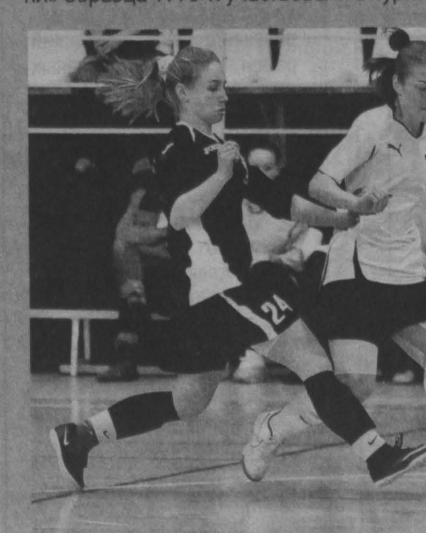
Голевая атака «Кузбасса-1» (в белой форме) в финальном матче турнира с «Кузбассом-2».

Ныне в традиционном турнире памяти Сергея Прокопьева в двух возрастных группах соперничали десять команд из Кемерово, Томска, Барнаула, Ленинска-Кузнецкого и Ленинск-Кузнецкого района. В старшей группе первенствовал «Кузбасс», в младшей – дружина школы №31 областного центра. Игроки «Южанки» образца 1990-х участвовали в турни-