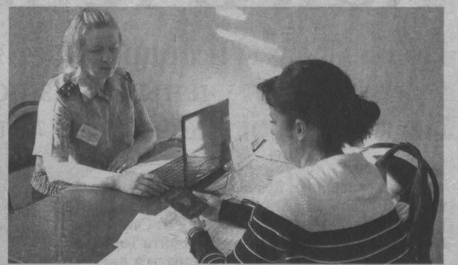
За шесть с небольшим лет действия программы по переселению соотечественников в Кузбасс из-за рубежа переехали жить около двенадцати тысяч человек.

Данная программа действует в регионе с 2009 года, за это время к нам из-за рубежа переехали на постоянное место жительства около двенадцати тысяч соотечественников.