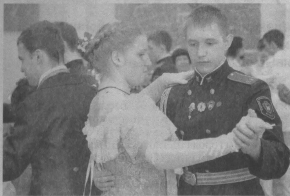
Весенний масленичный бал в областной библиотеке.