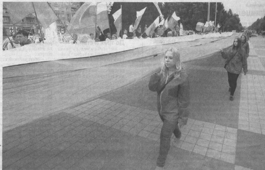
РАВНЕНИЕ НА ТРИКОЛОР. Вчера, в День государственного флага России, в Кемерове прошла молодежная акция «Флаг державы – символ славы». Активисты молодежных организаций провели флеш-моб «Молодежный триколор», пронесли по бульвару Строителей флаг длиной 180 метров. Также прошли викторины, игровые программы, желающие могли нанести себе триколор – анаграмм, работали интерактивные площадки, прошли фото-акция «Я россиянин» и конкурс рисунков на асфальте «Россия – Родина моя».