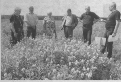
Руководители сельхозпредприятия Тяжинского района уже сейчас готовы приобрести многообещающий новый сорт клевера.