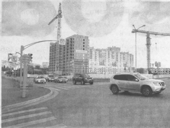
Новые участки автодорог в Кемерове делают проезд по городу быстрее и комфортнее.

В ближайших планах ЦОДД – устройство правоповоротного шлюза (участка дороги, предназначенного для поворота направо вне зависимости от сигнала светофора на перекрестке. – Прим. ред.) на пересечении улиц Сибиряков-Гвардейцев и Каменская, организация двусторонне-