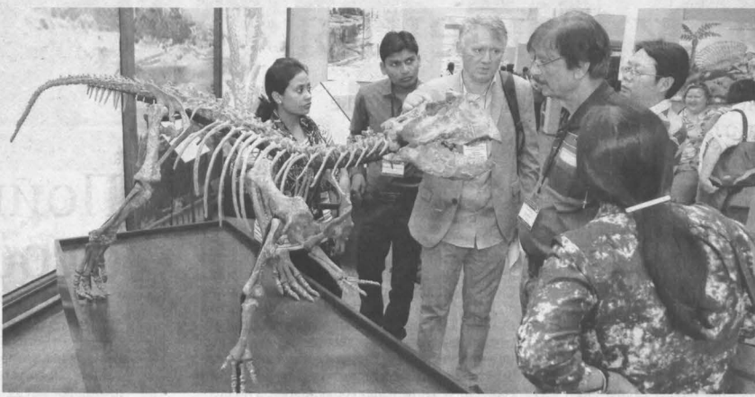
Полный скелет (копия) русского динозавра представлен мировой научной общественности впервые.

Сначала зарубежных гостей привезли в областной краеведческий музей – чтобы познакомиться с природой современного Кузбасса. Чучела млекопитающих и волков у экскурсантов пользовались огромной популярностью: с ними они то и дело фотографировались. В составе делегации – 25 иностранцев, преимущественно представителей Юго-Восточной Азии и Индии, и для них сибирские животные, конечно, экзотика. Но всё-таки глав-