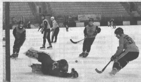
Первая в межсезонье ледовая тренировка — долгожданное событие для мастеров русского хоккея.

На этой неделе «Кузбасс» тренируется дважды в день: утром — на «земле», вечером — на льду. Первое занятие на крытом катке продолжалось полчаса и закончилось двусторонними играми на половинах поля в формате «7 на 7». Последний рубеж обороны четырёх команд защищали Сергей Морозов, Евгений Во-