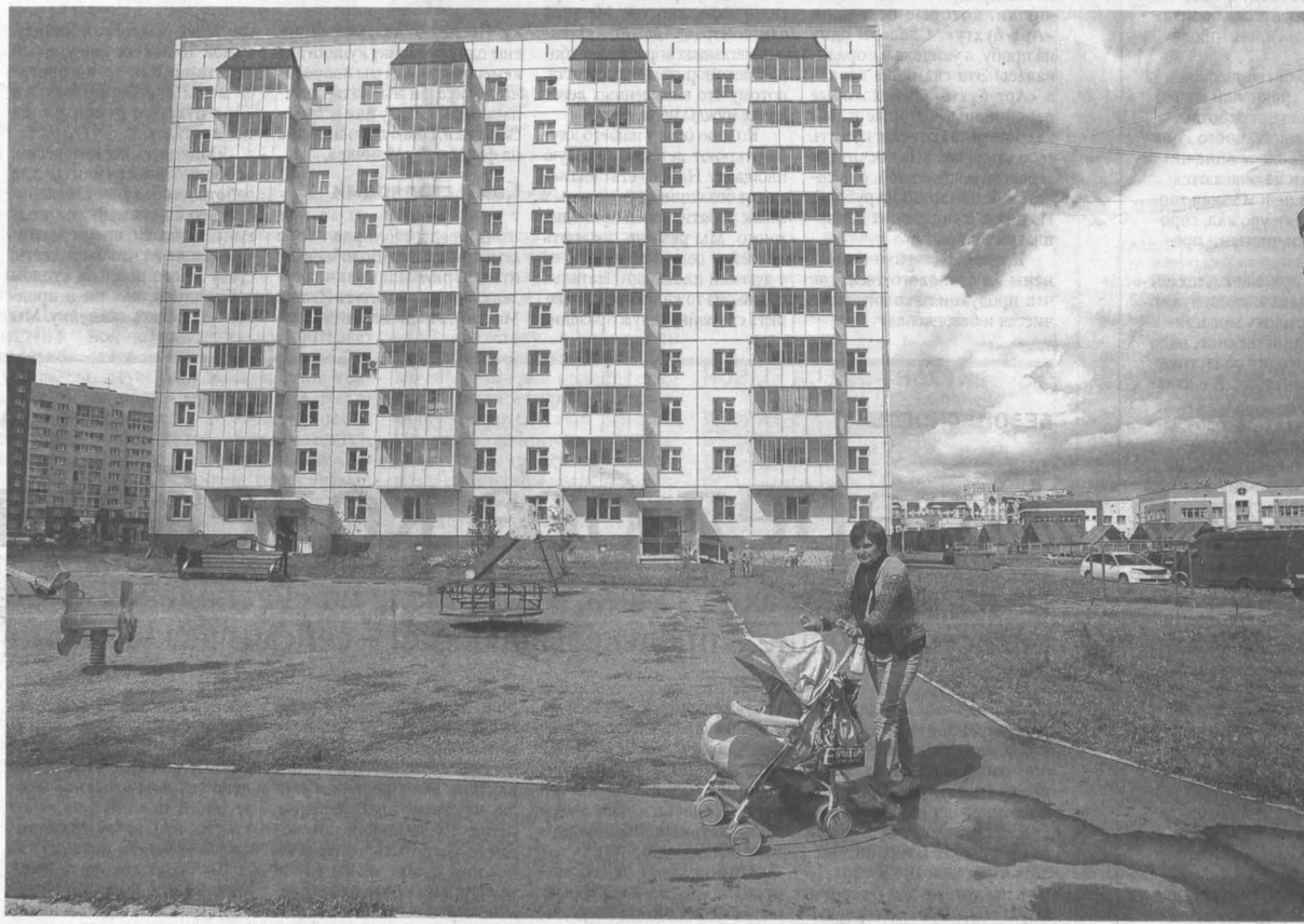
Льготная аренда в доходном доме – дополнительный стимул к рождению детей.

Как доходные дома справляются с ролью, которая изначально отводилась им в решении жилищной проблемы молодых специалистов?