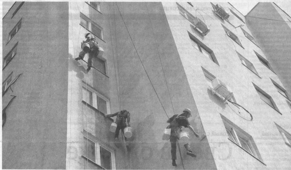
Собственники жилья по ул. Тухачевского, 39, приняли решение обновить фасад.

В текущем году в Кузбассе капитально отремонтируют 600 многоквартирных домов (МКД). На эти цели направляется почти полтора миллиарда рублей