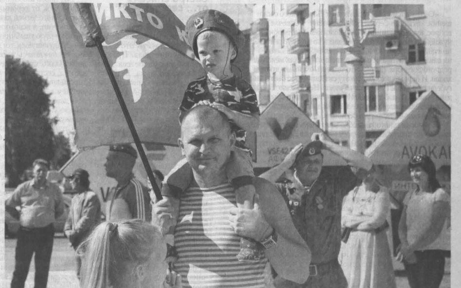
ПРАЗДНИК ГОЛУБЫХ БЕРЕТОВ. Вчера в Кузбассе прошли праздничные мероприятия, посвященные 84-й годовщине образования Воздушно-десантных войск России. По традиции бойцы этого рода войск приняли участие в митингах. В Киселевске, к примеру, открылся новый памятник на аллее Воинской славы, который изготовлен на средства ветеранов ВДВ. Ну и, конечно же, не обошлось без праздничных гуляний и встреч с сослуживцами. Так что вчера в городах Кузбасса повсюду можно было увидеть настоящих мужчин в голубых беретах.