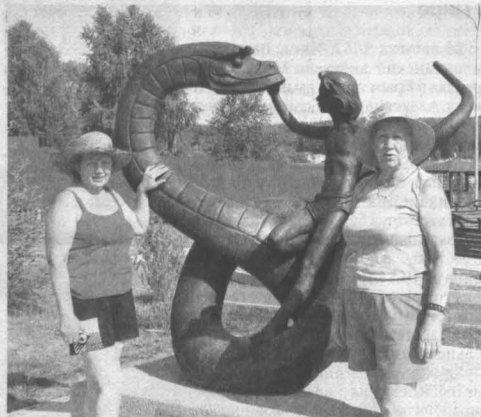
На фоне Маугли.

А с каким удовольствием и прямо-таки ребячьим восторгом взрослые дяди и тети фотографируются на фоне здешних скульптур! Например, у «Храброго Маугли с мудрым удавом Каа».