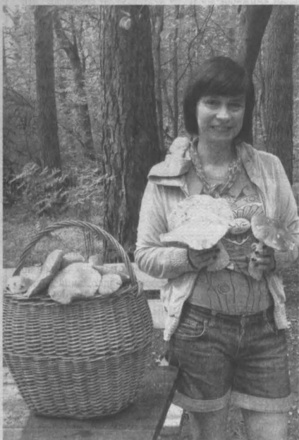
В деревне журналистов Антиповка, что в бору неподалеку от деревни Журавлево, в минувшие дни проводилось немало фотосессий с отборными белыми грибами.