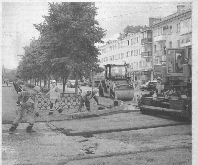
Ремонт дороги на улице Спартака.