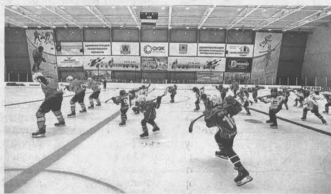
Мастер-класс для юных ленинско-кузнецких хоккеистов.

Никита Языков) в течение часа занимались с мальчишками 2007-2008 годов рождения. В мастер-классе участвовали три вратаря и 22 полевых игрока.