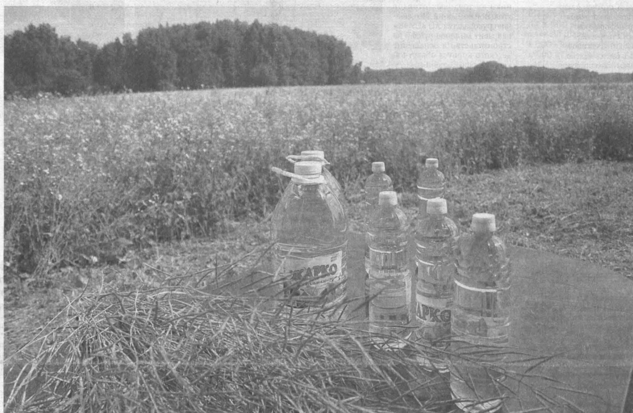
Рапсовые дары на фоне рапсового поля.

Какие риски возможны при работе с рапсом?