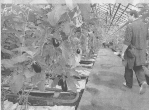
Тепличные условия для бизнеса в Юрге создают в надежде на хороший инвестиционный урожай.

В этом же году собирается запустить новый цех том-