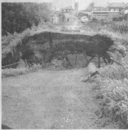
Местные жители выложили в сеть фото обвалившейся переправы.