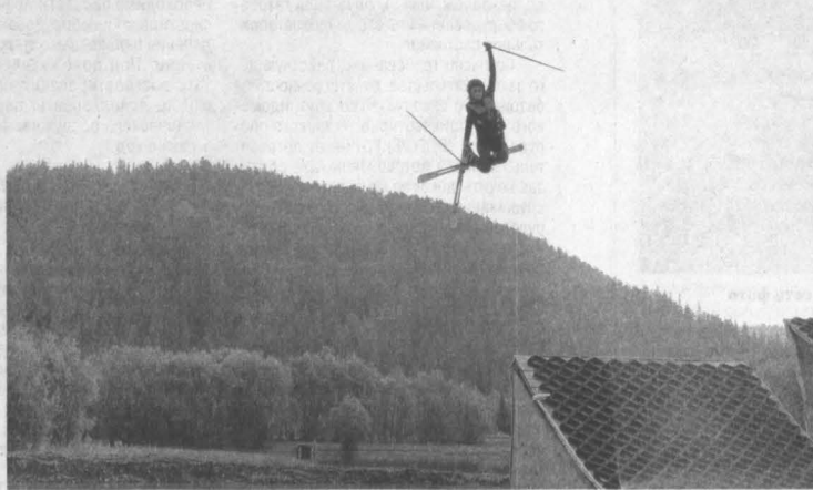
■ Наши спортсмены отработывают сложные прыжковые элементы дома.

«Всё великое – просто, – объясняет Константин Васильевич. – Казалось бы, ничего сложного в таком трамплине нет, но в России он появился только сейчас. Во всём мире эти трамплины – просто дерево, искусственное покрытие, трубы, форсуны, компрессор и воздушно-водяная подушка, которая смягчает приземление. Здесь всё это есть. К тому же, отмечу, спортсменам важна еще и инфраструктура. К примеру, за границей есть отели, находящиеся в горах, а к тренировочным базам приходится ехать на автобусе. А здесь есть всё необходимое, и всё рядом (здесь же, на «Саланге», имеется многофункциональный спорткомплекс