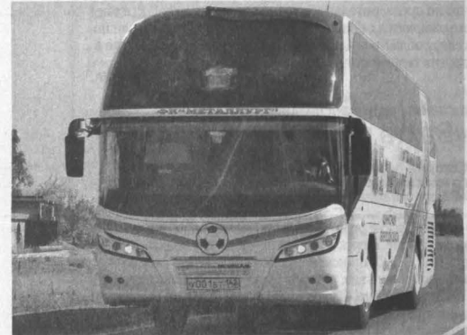
■ Найденный судебными приставами автобус ФК «Металлург», который считался пропавшим.