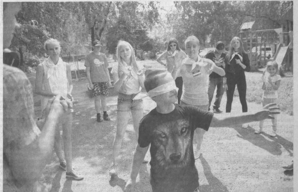
ВЕСЕЛОЕ ЛЕТО – ВО ДВОРЕ. В Новокузнецке бойцы педагогических отрядов «Радуга» и «Капелька» с пользой занимают школьников в дни их каникул и организуют развлечения прямо по месту жительства детей. Чтобы отвлечь подростков от электронных гаджетов, наставники, которые сами не намного старше подопечных, придумывают квесты, эстафеты и конкурсы. Впрочем, подзабытые дворовые игры в «Вороного коня» и в «Казак-разбойников» тоже проходят на ура.