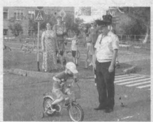
Дорожная азбука для всех 2

Издаётся с 7 января 1922 г. 79 (26447) Среда, 20 июля 2016