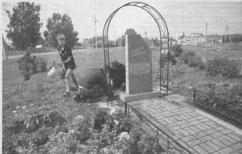
ПАМЯТИ ШАХТЕРОВ. Вчера в Кемерове активисты Центра по работе с населением «Петровский» благоустроили памятное место шахтерской славы: над камнем «Погибшим шахтерам шахты «Липицкая» они установили металлические арки, вокруг клумб - фигурный бордюр, высадили кустарники сирени. В канун главного праздника региона состоится торжественное открытие памятного места. Кроме того, будет дан старт акции «Мой дед - шахтер» по сбору информации о горняках и их семьях, проживающих в посёлке.