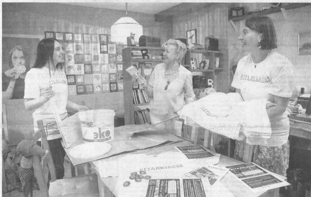
Организаторы заканчивают подготовку к фестивалю.

15-16 июля в столице Кузбасса пройдет первый фестиваль уличных искусств «Детализация»