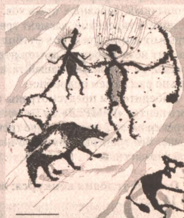
■ А в 2005-м компьютерная программа нашла у божества (справа) нимб, от которого отходят лучи.