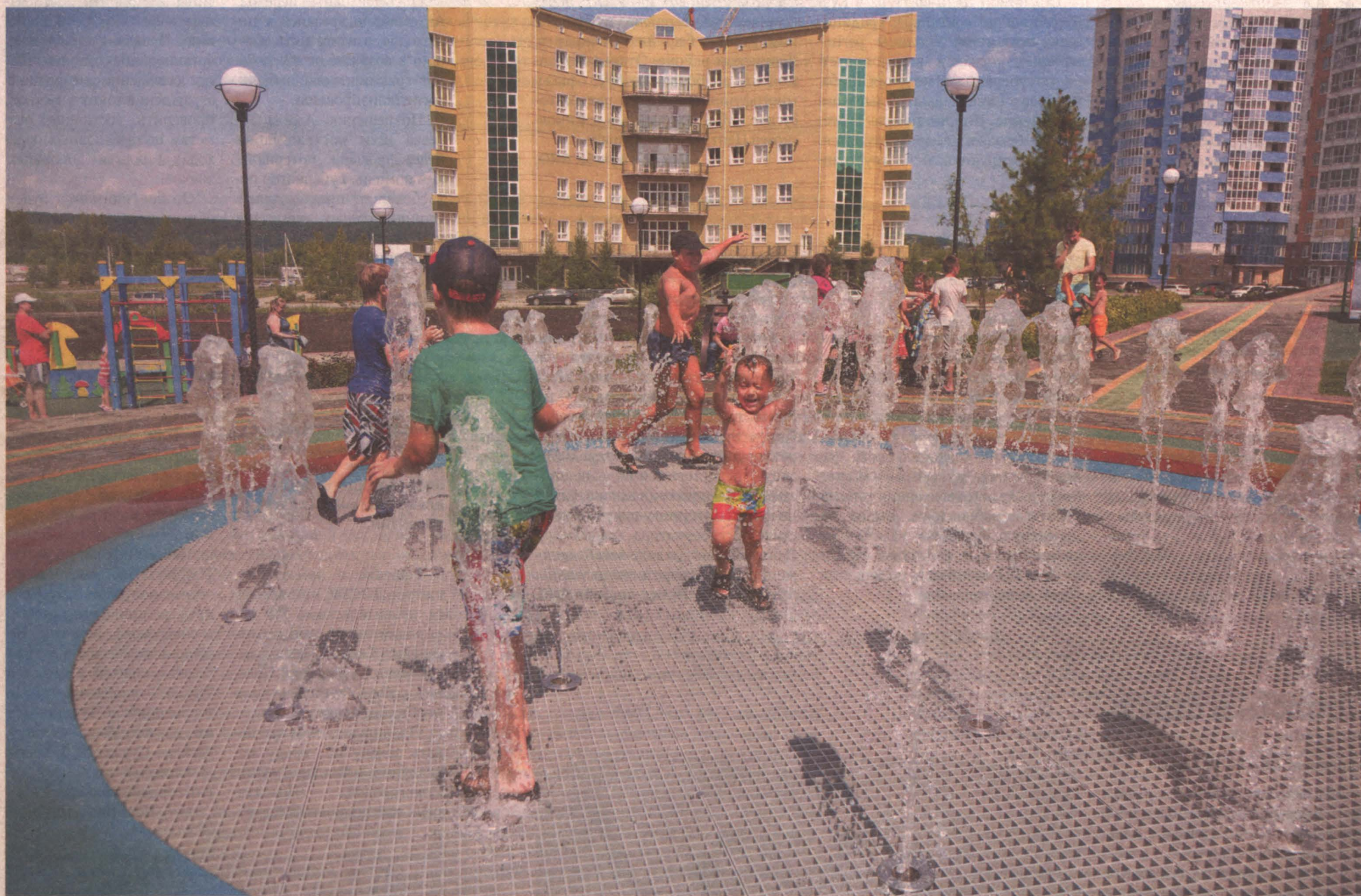
■ В жару нет отбоя от ребятишек, желающих поплескаться хотя бы в фонтане – как в этом кемеровском сквере имени Льва Резникова.