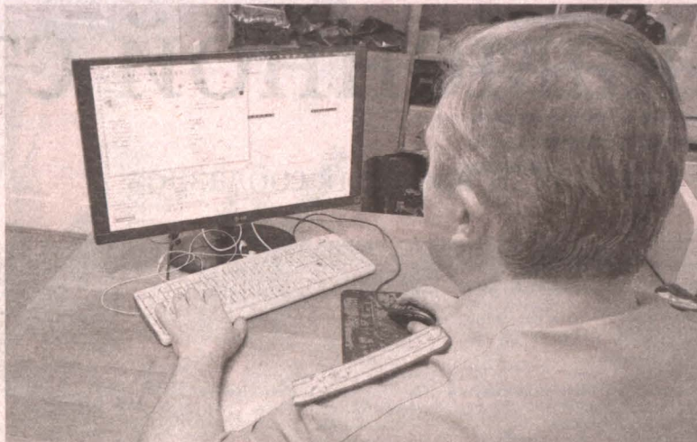
■ С помощью специальной компьютерной программы криминалисты сумели восстановить стертые видеозаписи и полностью воспроизвести картину случившегося в тренажерном зале.