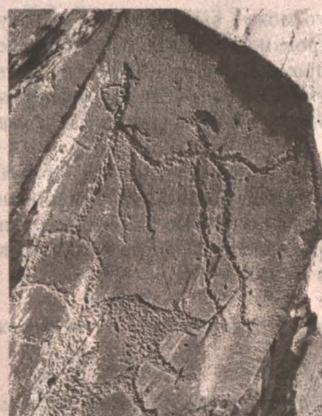
■ Много лет считалось, что рядом с медведем изображены какие-то божества.