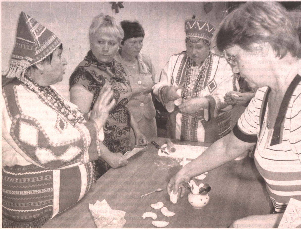
■ Мастер-класс по изготовлению мордовских пельменей с ливером.