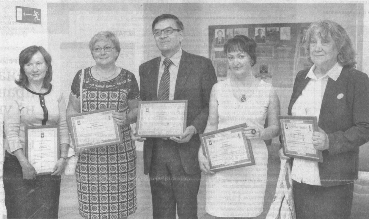
Эти кемеровские учителя, которые подготовили одиннадцатиклассников к сдаче ЕГЭ на высокие баллы, были вчера награждены Почетными грамотами администрации города. Педагогов (всего их 177) чествовали на торжественной церемонии в школе № 36.

Сегодня-завтра выпускники школ получат результаты последних экзаменов, и закончится ЕГЭ-кампания 2016 года