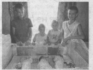
Двойня, два парня, тройня!

ГБУК Кемеровской области им. В.Д.Федорова Газетно-журнальный фонд