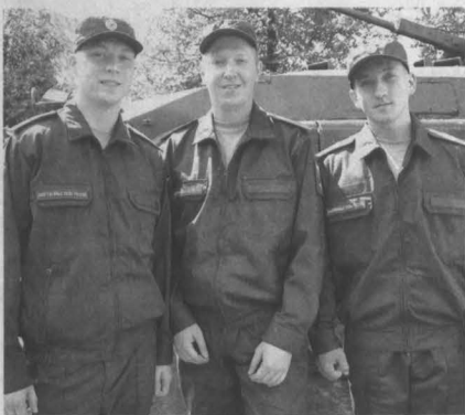
Уже скоро эти ребята приступят к службе в научной роте в Санкт-Петербурге.