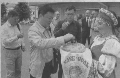
Гостей из Поднебесной встретили хлебом-солью и русской народной песней.