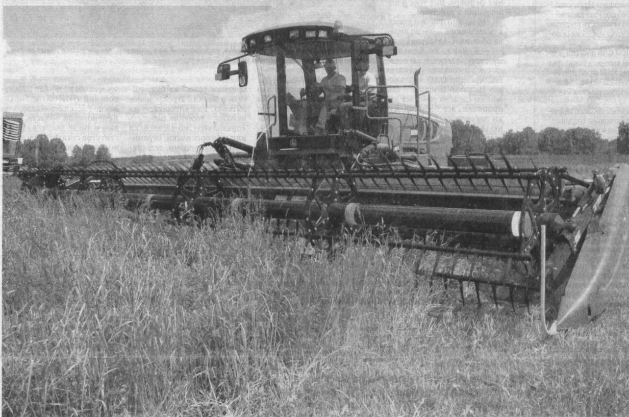
В Кузбассе начата заготовка кормов.

Июль — время наибольшей концентрации полевых работ. В полях всё растёт (должно расти) как на дрожжах, события здесь происходят в это время с невероятной быстротой и в максимальных количествах, требуя знаний и отменной реакции, быстрого принятия адекватных решений. Вот, к примеру, кто может сожрать в это время полюбившийся кузбасским аграриям рапс: крестоцветные блошки и клопы, капустная и рапсовая белянки, капустные моль и совка, рапсовые пилильщик и цветоед, семенной скрытнохоботник, капустная тля... Смотри в оба, травы, иначе всё сожрут! Кто не успел, тот опоздал — это про него, про июль.