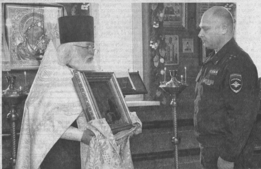
Сотрудники кузбасского СОБРА «Символ» передают найденную в Грозном старинную икону Иоанна Крестителя в храм Святой Блаженной Ксении Петербургской.

Сейчас эта икона – одна из святынь храма. Она выставлена на аналое, напротив царских врат, и к ней могут прикоснуться все желающие