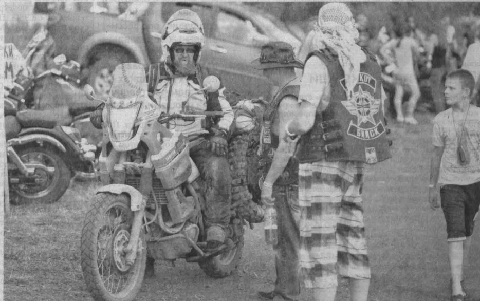
МОТОСТРАННИКИ НА ПРИВАЛЕ! Более четырех тысяч человек собрал в выходные байкерский фестиваль «Полный газ!» близ Кемерово. Приехали гости, байеры-дальнобойщики, не только из разных регионов России, но и из-за рубежа: из Казахстана, Украины, Кореи, Ирландии. Они были отмечены призами за такой дальний прогреб. А в целом, как отметили организаторы, фестиваль прошел достойно. Единственное, что несколько омрачало праздник, — это дождь. Но стойкую публику он не испугал, и площадка у эстрады не пустовала.