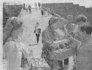
Праздник на многих улицах