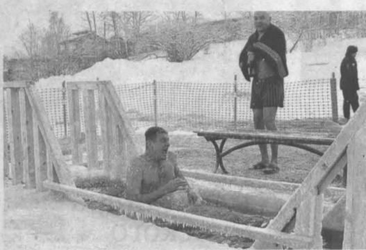
В Кемерове массовые купания прошли в том числе и в купели на озере Красное.