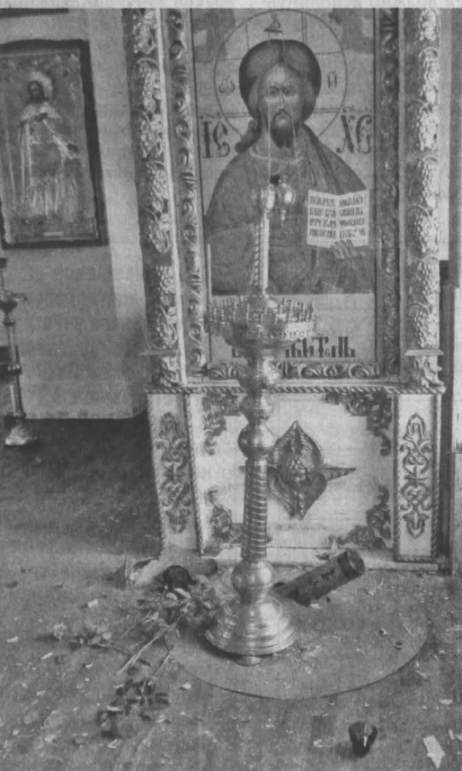
Ракета врезалась в пол под иконой Господа Вседержителя и не взорвалась, икона Александра Невского рядом, слева.

Подробнее о животных в кемеровском приюте можно узнать по телефонам: 8-905-076-04-47 (Татьяна), 8-913-307-04-56 (Людмила), 8-950-264-54-94 (Людмила Еременко).