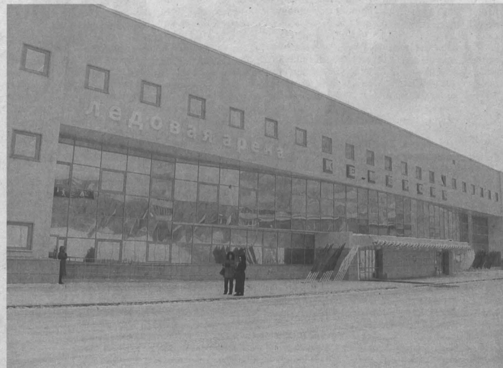
Новый спортивный комплекс украсил кемеровский район ФПК.