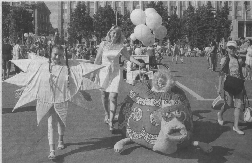
ДВА ПРАЗДНИКА. Парадом необычных колясок отметили День города кемеровчане. На городских развлекательных площадках прошло также множество и других интересных мероприятий и конкурсов. Ну а в День России, что отмечался в этот же день, кемеровчане исполнили гимн страны на площади Советов. Это стало традицией. Праздничная программа продолжилась флэшмобом «Барабанщицы России», который стартовал одновременно по всей стране, и фестивалем «Мой город – моя судьба».