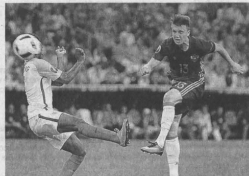
Двадцатилетний Александр Головин (№ 13) – самый молодой игрок сборной России на Евро-2016.

«Креативное игровое мышление, хорошо поставленный удар, отменные бойцовские качества и отменная