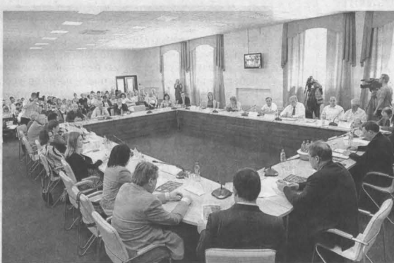
За круглым столом региональные власти, энергетики, угольщики, ученые обсудили проблемы и перспективы угольной отрасли в Кузбассе.

Сибирская генерирующая компания выступила организатором круглого стола, посвящённого проблемам и перспективам угольной отрасли в Кузбассе.