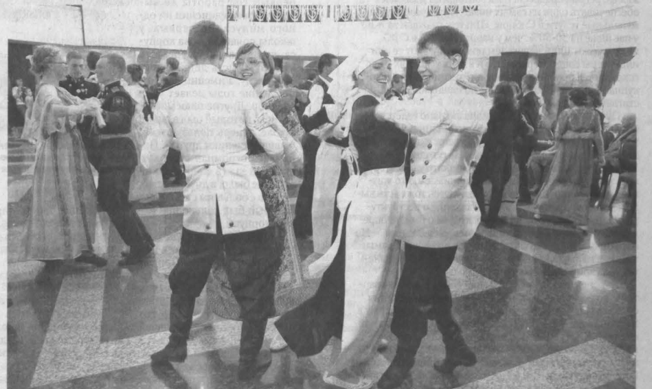
ОФИЦЕРСКИЙ БАЛ прошел в минувшую субботу в Музыкальном театре Кузбасса им. А. Боброва. Этот бал – победитель муниципального конкурса социально значимых проектов. Он реализован в рамках федерального проекта «Великая забытая война. 1914–1918 гг.». Участники бала ознакомились с историей начала XX века: увидели своими глазами и даже приняли непосредственное участие в реконструкции настоящего светского бала. Опытные инструкторы-танцевальщики провели мастер-классы.