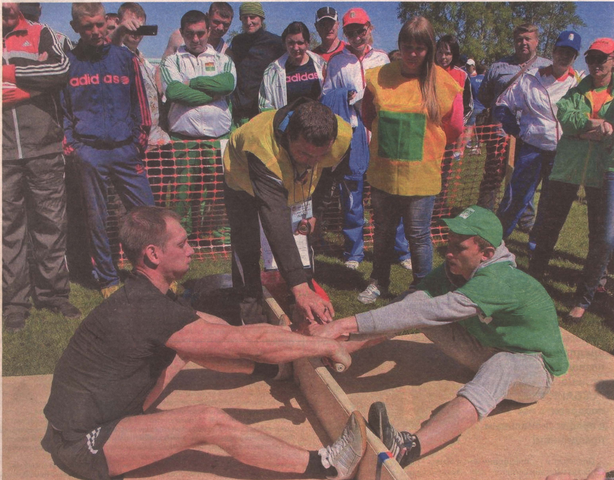
■ Кузбасские предприниматели и в конкурентной борьбе проявляют себя по-спортивному честно.

С Днем российского предприни- мательства!