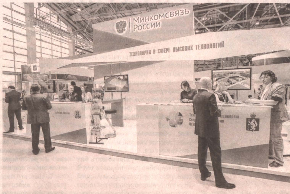
■ Стенд технопарков на форуме Открытые инновации-2015.

Конечно, Кузбасский Технопарк - не банковская структура и не промышленное производство. Выдать кредит, субсидию или наладить выпуск продукции здесь не смогут. Но делают самое важное для того, кто всерьез решил воплотить свою идею в жизнь, наладить инновационное производство, - здесь помогают определить слабые места проекта, обучить сотрудников, провести маркетинговые исследования, подготовить инвестиционный проект для того, чтобы запустить процесс. И это есть самая реальная помощь бизнесу: дать знания и инструменты для развития. «С помощью Кузбасского Технопарка даже у начинающих предпринимателей есть возможность получить так называемое «предпосевное финансирование», - говорит руководитель Центра кластерного развития (ЦКР) Кузбасского Технопарка Наталья Чурсина. - Мы помогаем молодым начинающим предпринимателям понять, как из идеи сделать продукт. В прошлом году по программе УМНИК мы рассмотрели 276 проектов молодых ученых и инноваторов Кузбасса. И по итогам двухуровневого отбора представлены к финансированию 35 перспективных к реализации проектов по направлениям: информационные технологии, медицина будущего, современные материалы и технологии их создания, новые приборы и аппаратные комплексы и биотехнологии...» Эти 35 ребят получают 400 тысяч рублей на два года, с помощью которых смогут научно апробировать идею. А всего за 6 лет работы по этой программе было привлечено порядка 70 миллионов