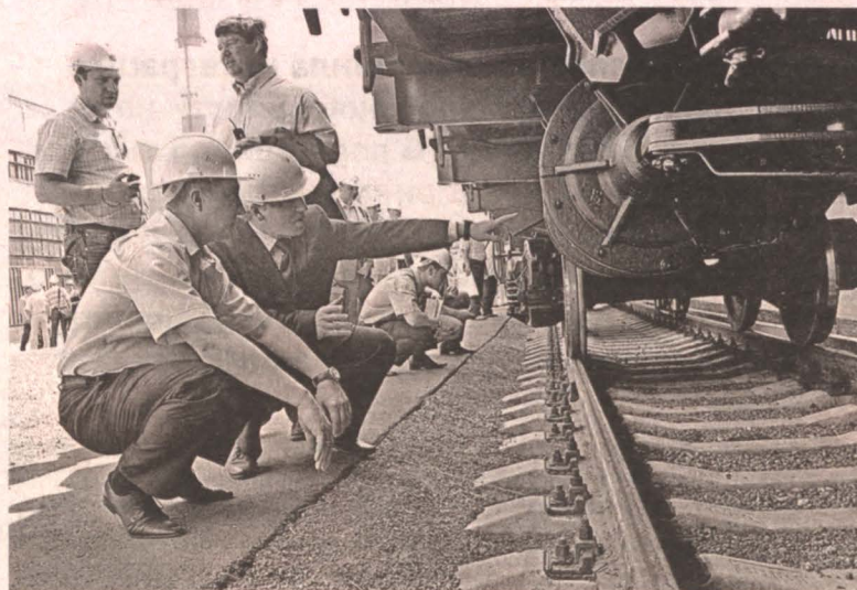
■ На базе Новокузнецкого вагоностроительного завода будет организовано шесть новых производств.

В числе последних достижений кузбасских учёных – трансформатор нового поколения. В качестве обмотки в нём использована фольга из чистого железа. Этот материал позволил сделать трансформатор в шесть раз компактнее прежнего, при тех же технических характеристиках. Такой прибор оценят и в шахте, и в железнодорожном хозяйстве. Кстати, для РЖД в Новокузнецке планируют запустить производство стрелочных переводов и рельсовых скреплений под мировым брендом Vossloh. Региональный президент компании по России и СНГ