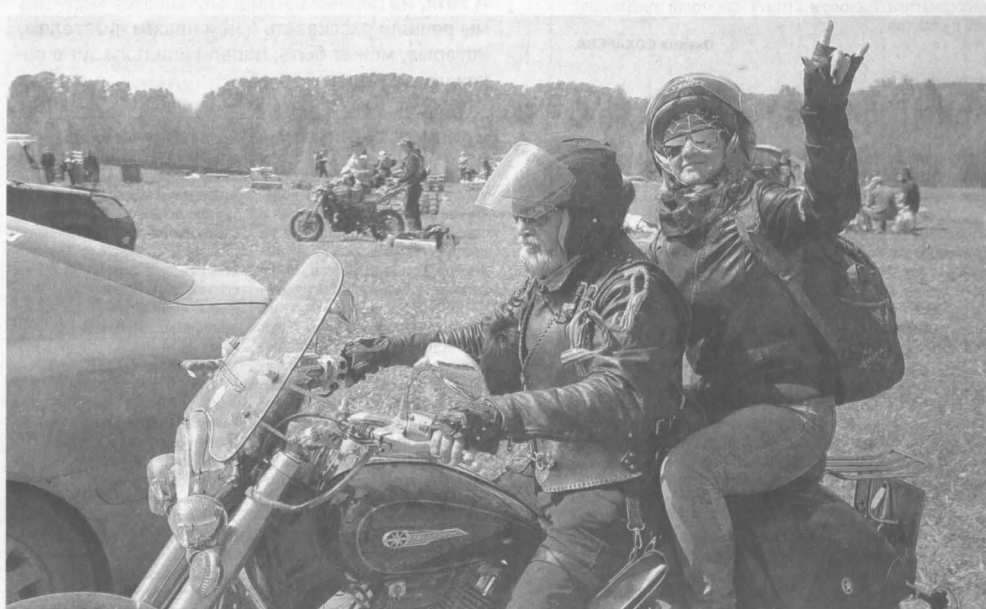
БАЙКЕРЫ ОТКРЫЛИ СЕЗОН. Около двухсот мотоциклистов и сотни зрителей собрались в выходные близ Новокузнецка на открытие сезона. Организаторы байк-шоу постарались учесть интересы всех представителей сообщества. В числе мероприятий был кросс по пересеченной местности, шуточные состязания «Медленная езда», «Накачай колесо» и конкурс на самую интересную татуировку. В отдельной категории состязались самодельные машины. И впервые в шоу приняли участие ретромотоциклы: от легендарного английского «Триумфа» 1935 года выпуска до советского «М-72» военной комплектации - с минометом!