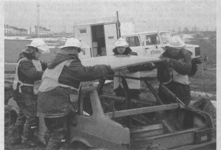
Нештатное аварийно-спасательное формирование вскрывает кузов автомобиля, где находится условно пострадавший.