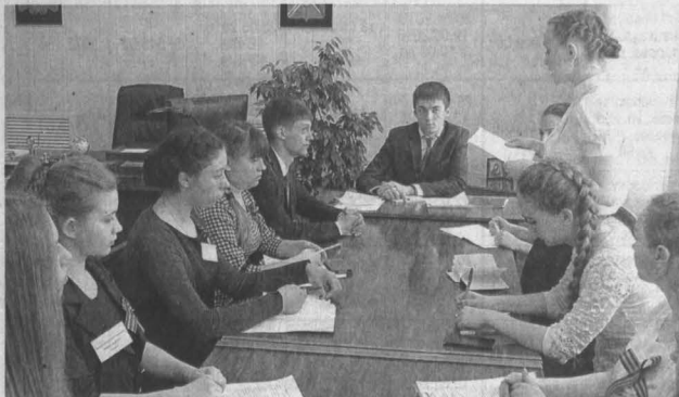
24 старшекласника, занявшие в Тажинском муниципалитете ключевые посты, предварительно прошли стажировку. Поэтому они были готовы решать совсем не детские проблемы.