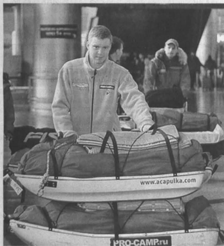
Александр Песков в московском аэропорту «Внуково» перед отправлением на станцию «Барнео».