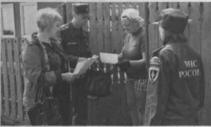
Рейд в Кемеровском районе.