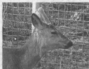
Единорог из Междуреченска 6

788733 ГБУК КеОИИ им. В.Д.Федорова Газетно-журнальный фонд НОВОСТИ