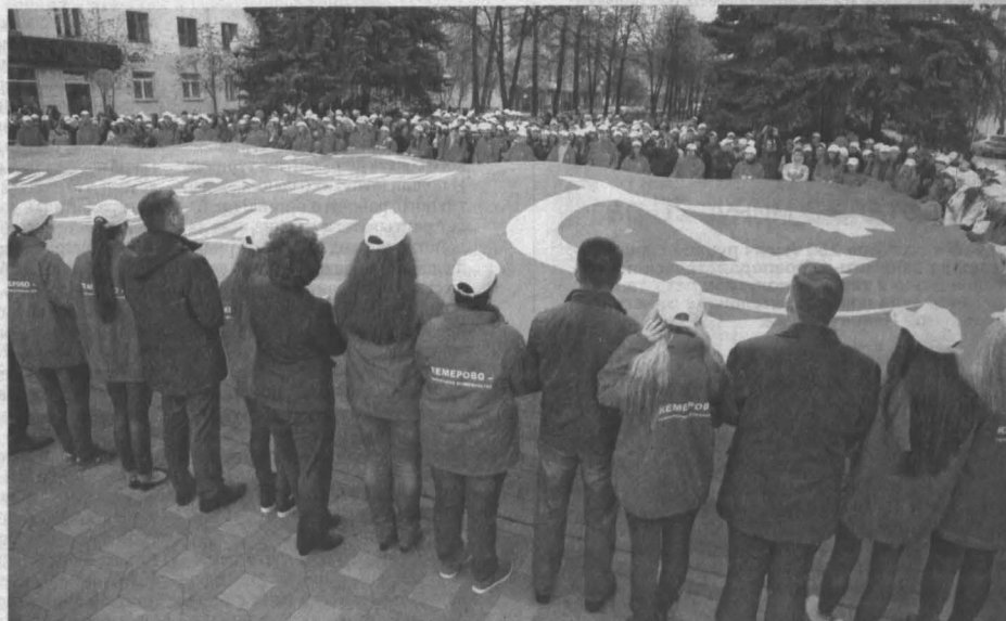
ЗНАМИ ПОБЕДЫ. Вчера в Кемерове около Вечного огня участники Международного автомарша «Эстафета памяти — звезда нашей Великой Победы» передали городу необычное Знамя Победы — размером около 200 кв. м. Автомарш стартовал 5 апреля по пяти маршрутам из Архангельска, Бреста, Севастополя, Дербента и острова Русский (Приморский край) по направлению к Москве. До 9 мая активисты посетят 100 городов страны и в каждом передадут копию Знамени Победы. У нас она будет храниться в областном отделении общероссийской организации «Боевое братство» и примет участие в шествии «Бессмертного полка».