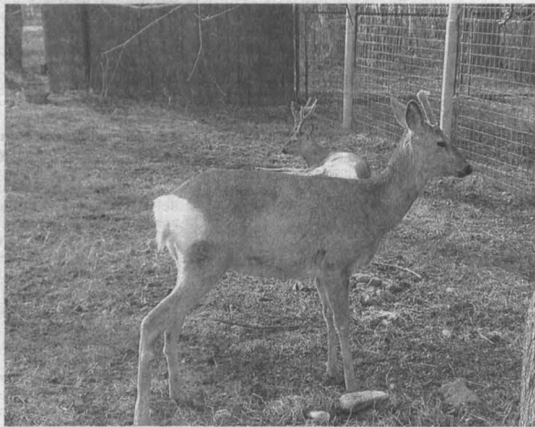
■ Единорог Маша и косуля Кузя живут в вольере дружно.

сбоях и в основном у старых животных, так как все системы организма с возрастом изнашиваются. Но эта косуля – молодая. И можно предположить, что это следствие травмы паховой области, после которой могло произойти подавление одних гормонов другими. При недостатке женских гормонов мог появиться рог. Травма или стресс как причина сбоя могли произойти в то время, когда косуля находилась вне вольерного комплекса.