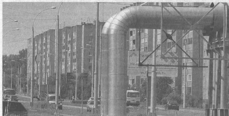
Комфортная температура воздуха в квартире и горячая вода – это результат совместной работы производителей, транспортировщиков и потребителей тепловых ресурсов.

АО «Кемеровская теплосетевая компания» – ведущее теплоэнергетическое предприятие города Кемерово. Осуществляет передачу тепловой энергии и теплоносителя от Кемеровской ГРЭС, Ново-Кемеровской ТЭЦ и Кемеровской ТЭЦ (входят в группу «Сибирская генерирующая компания») по системе централизованного теплоснабжения на территории города Кемерово и части Кемеровского района. На обслуживании у компании сейчас находится 927 км магистральных и квартальных тепловых сетей (в одностороннем исчислении).