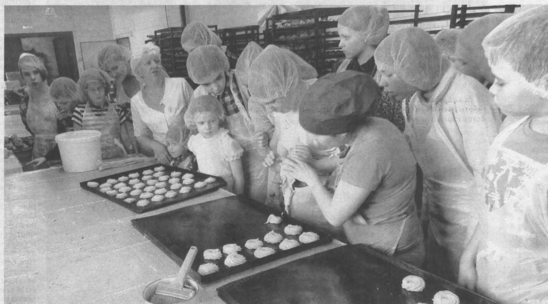
Во время экскурсии на кондитерскую фабрику можно не только познакомиться с технологией производства, но и продегустировать собственноручно приготовленные сладости.