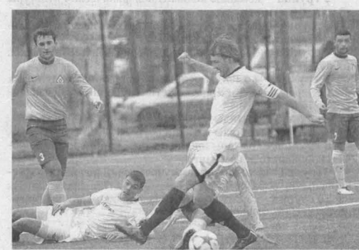
■ Игроки «Распадской» (в белой форме) в финальной стадии турнира памяти Фомичева на равных соперничали с барнаульским «Динамо», но уступили с минимальным счетом.

Кстати, накануне турнира «Распадская» провела двухнедельный подготовительный сбор в Крымске, что в Краснодарском крае. На юге страны сибиряки сыграли несколько контрольных матчей, в том числе и с «Читой» (0:2), где главным тренером с нынешнего года работает наш земляк Константин Дзуцев, возглавлявший в свое время кемеровский и новокузнецкий клубы.