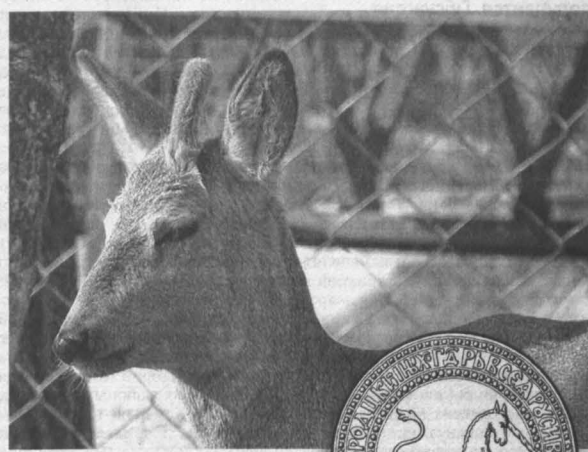
■ Сравни Кузбасский единорог на пути превращений, высота рога 15 см – и единорог с печати Ивана Грозного.