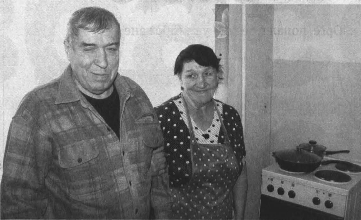
На своей кухне и обед вкуснее!

...Но в Прокопьевске есть не только дом инвалидов, от которого наотрез отказался Юрий Дмитриевич. Есть еще и дом ветеранов. Там у людей не просто койко-место, а отдельные квартиры. Правда, они социальные. Их нельзя приватизировать, заветх по наследству. На такое жилье имеет право незрячий инвалид с особым удостоверением?