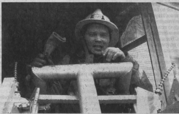
Назир за 16 лет службы потушил тысячи пожаров в городе, а скольким людям помог — давно перестал считать.