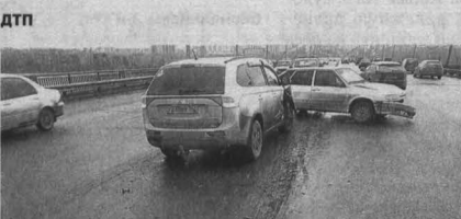
Из-за столкновения двух автомобилей движение по мосту было значительно затруднено.