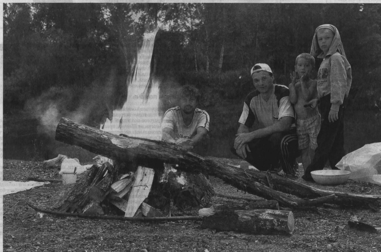
С 15 апреля в Кузбассе вводится особый противопожарный режим. И у человека, который разожжет костер в лесу, гораздо больше шансов быть оштрафованным за нарушение правил пожарной безопасности, чем за рубку деревьев.

Нововведения Рослесхоза ужесточили правила пользования лесными ресурсами. И теперь многие опасаются, что нельзя будет спилить даже сухой сук для костра или подобрать валежник, поскольку такие действия приравниваются к хищению и уголовно наказуемы. Так ли это на самом деле?