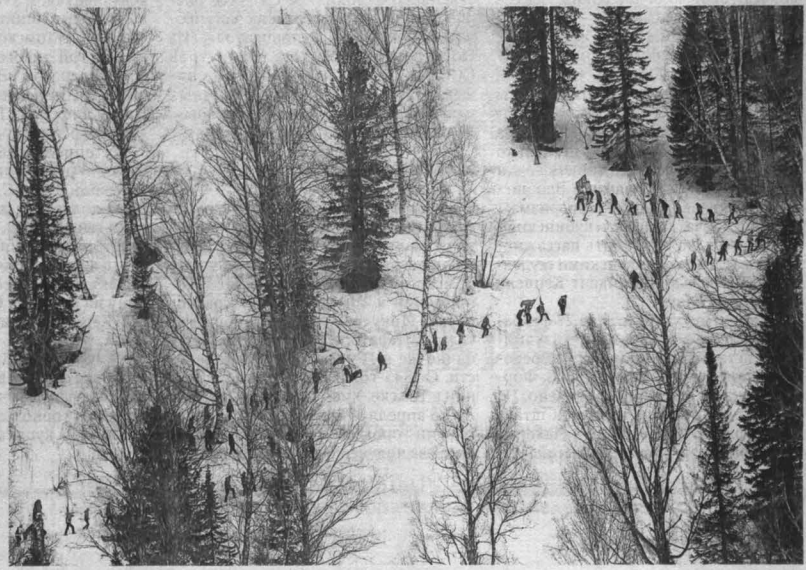
Участники похода на вершину им. А. Шилина.