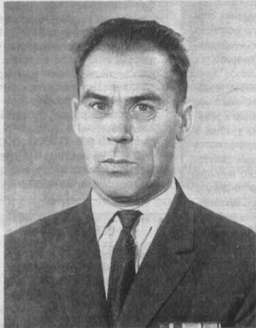
Александр, сибирский сын Сталина.

А мне тайну, что я внук Сталина, родители раскрыли,