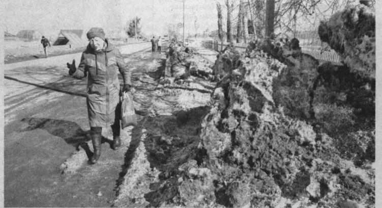
В конце марта по тротуару еще нельзя было пройти — только по краю дороги.