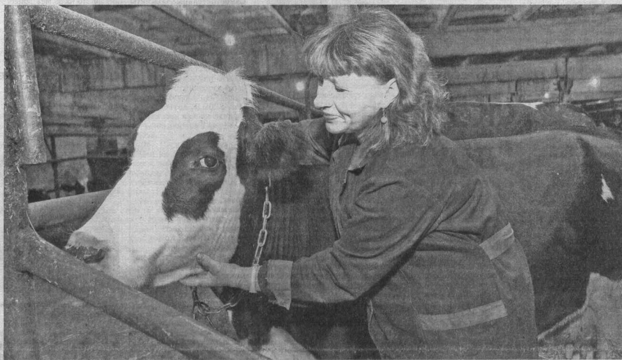
■ Без нее, коровы, мы рискуем есть фальсификаты и «пальму».

Молоко - один из тех продуктов кузбасского АПК, по которым до самообеспечения нам неблизко.