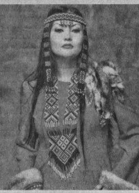
■ Платье актуального фасона дополнено этническими деталями.

Дизайнер из Кемерова создала современную платформу «Шорианка» по мотивам шорской и алтайской национальной одежды.