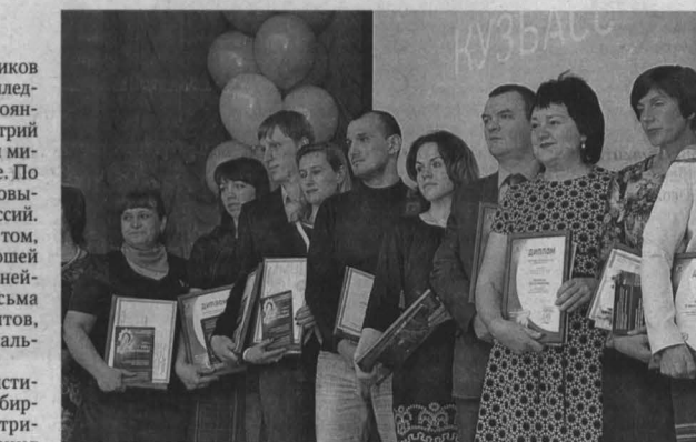
На церемонии закрытия областного конкурса «Преподаватель года-2016» было хорошо видно: среди талантливых педагогов СПО Кузбасса много молодежи.

А что касается Риты – она убеждена в правильности своего выбора, у нее есть жизненный план, которому она и следует. В техникуме девушка привлекла специальность «Правоохранительная деятельность».