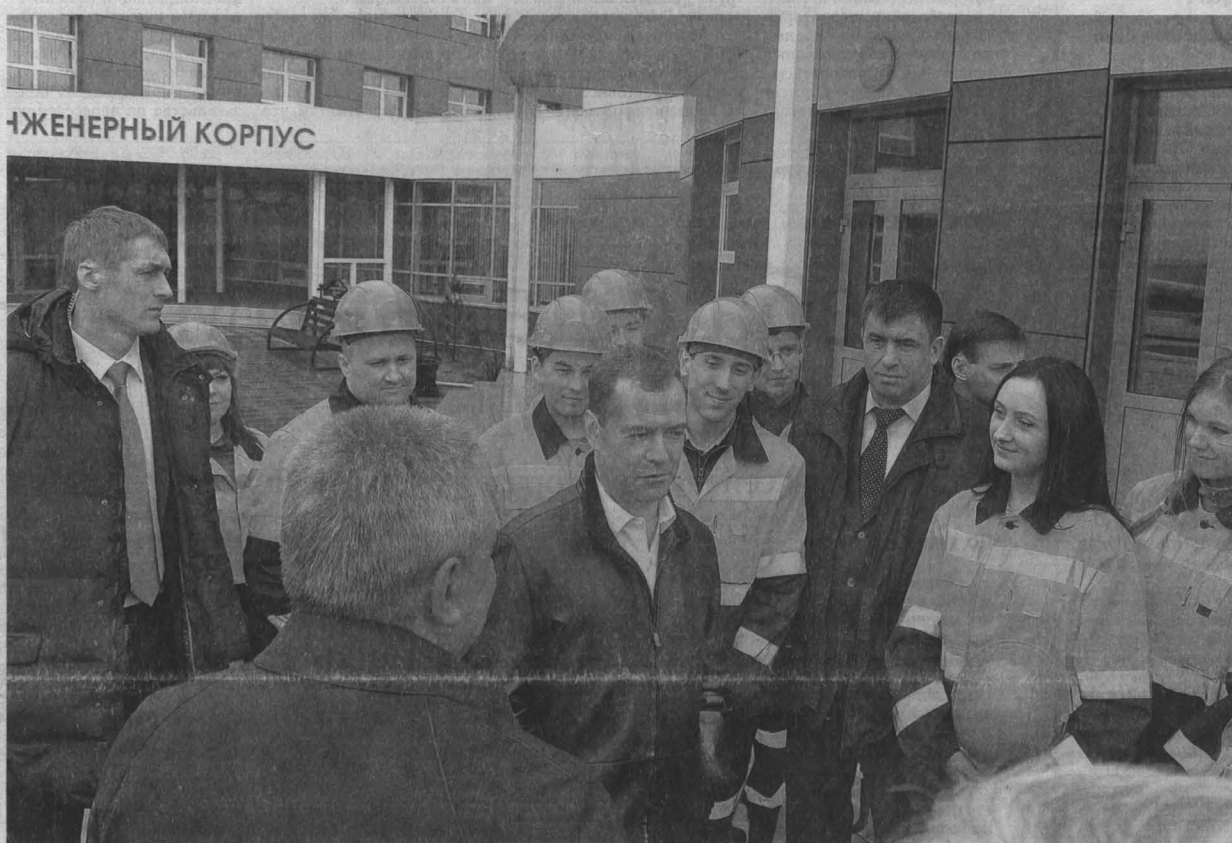
Дмитрий Медведев на разрезе «Березовский».

Председатель правительства РФ Дмитрий Медведев провел в Новокузнецке совещание о состоянии и перспективах развития угольной промышленности