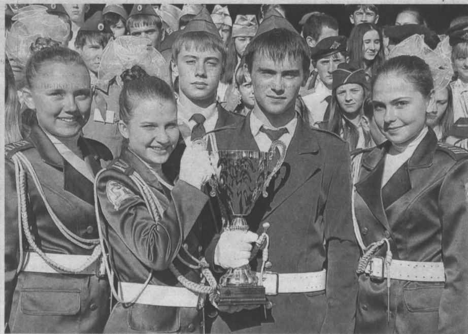
Победители одной из профильных смен юных друзей полиции, которые ежегодно проходят в оздоровительно-образовательном центре «Сибирская сказка», – члены отряда «Рыная команда» из города Юрги.

Администрация Гурьевского муниципального района, в соответствии с требованиями пункта 4 статьи 12 Федерального закона №101-ФЗ «Об обороте земель сельскохозяйственного назначения» от 24.07.2002г., сообщает информацию о возможности приобретения земельных долей на условиях, предусмотренных данной статьей: 9 февраля 2016г. Управлением Федеральной службы государственной регистрации, кадастра и картографии по Кемеровской области за муниципальным образованием «Гурьевский муниципальный район» зарегистрировано право собственности на земельную долю в размере 9,4 га, из земельного участка общей площадью, 56839300 кв.м с кадастровым номером 42:02:000000:154, из земель сельскохозяйственного назначения – для сельскохозяйственного производства, местоположение: Кемеровская область, Гурьевский район, СПК «Саларский», о чѐм в Едином государственном реестре прав на недвижимое имущество и сделок с ним 09.02.2016г. сделана запись регистрации № 42-42-/002-42/121/003/2016-115/2. По интересующим вопросам обращаться по адресу: Кемеровская область, г. Гурьевск, ул. Ленина, 52, каб. №2, часы приема с 8.00 до 17.00, перерыв с 12.00 до 13.00, суббота, воскресенье-выходной, телефон для справок 8(38463) 55274. И.о. председателя КУМИ Гурьевского муниципального района Ж.В. Рожкова.