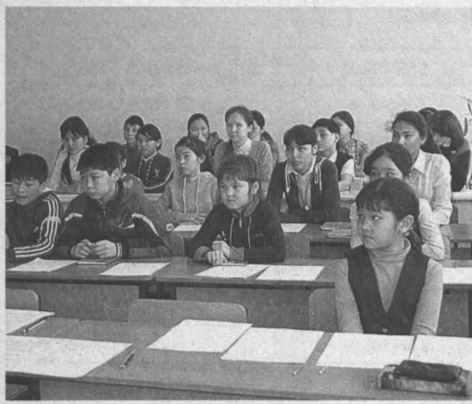
Идет конкурс переводчиков.