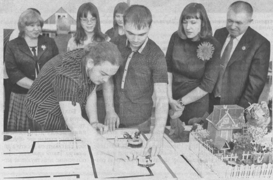
Роботы Миша и Маша на старте.