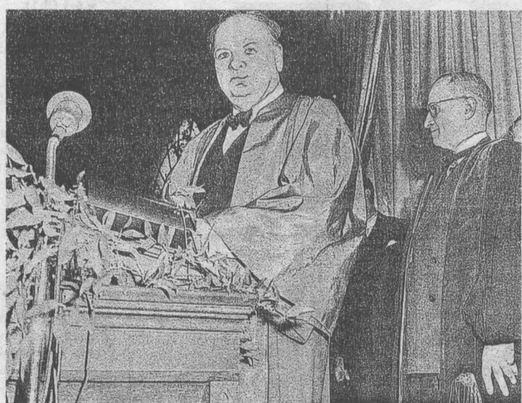
У. Черчилль (перед микрофоном) и Г. Трумэн в мантиях докторов философии Фултонского университета (штат Миссури, США, 5 марта 1946 года).

«Совершенно абсурдно говорить об исключительном контроле СССР в Вене и Берлине, где имеются союзные контрольные советы из представителей четырех государств и где СССР имеет лишь 1/4 часть голосов. Бывает, что иные люди не могут не клеветать, но надо все-таки знать меру». Счет верен, хотя Черчилль разве об «исключительном контроле СССР в Вене и Берлине» сказал? Далее у Сталина: «Немцы произвели вторжение в СССР через Финляндию, Польшу, Румынию, Болгарию, Венгрию. В результате немецкого вторжения Советский Союз безвозвратно потерял в боях с немцами, а также благодаря немецкой оккупации и угону советских людей на немецкую территорию – около 7 миллионов человек... в несколько раз больше, чем Англия и США, вместе взятые» 11 . 3/4 голосов «забыл» Черчилль в Контрольных советах, и 3/4 безвозвратных потерь СССР в 1941-45 годах «забыл» Сталин, так что квиты?.. И не за возможность ли погордиться перед бывшими союзниками обилием пролитой нами крови, к словам о гитлеровской оккупации применен предлог не «из-за», не «вследствие», а «благодаря»?