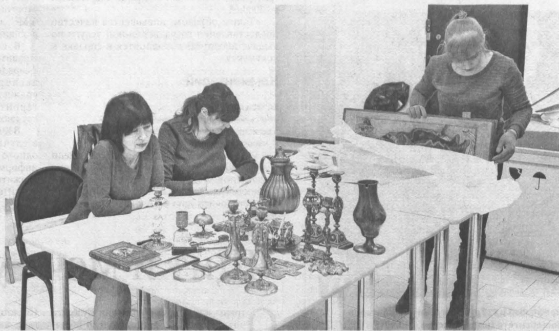
Сотрудники музея готовят экспонаты к выставке.