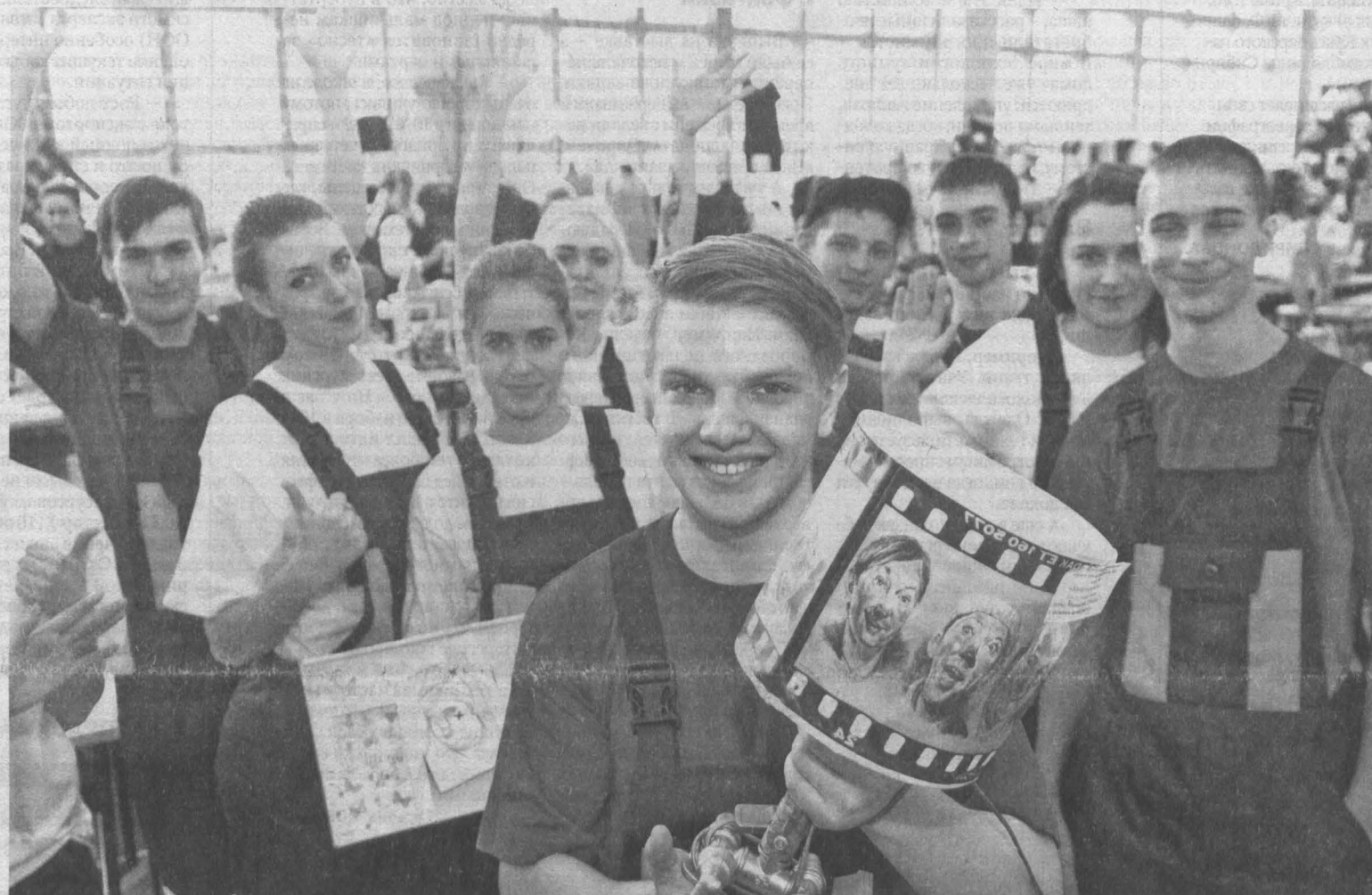
Кемеровский коммунально-строительный техникум им. В. И. Заузелова в рамках номинации «Сто идей для кино» представил настольную лампу из водопроводных кранов.

Среднее профессиональное образование стремится к высшему – это показал всекузбасский студенческий фестиваль «Арт-Профи Форум»