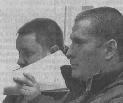
Братья-подельники на сьемке подсудимых.

В Центральном районном суде г. Новокузнецка начались слушания нового уголовного дела: двое родных братьев обвиняются в том, что под видом сотрудников Наркоконтроля обирали водителей автомобилей.