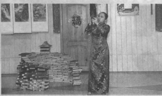
В первый день недели китайской культуры в КеМГИК прошел концерт-презентация.