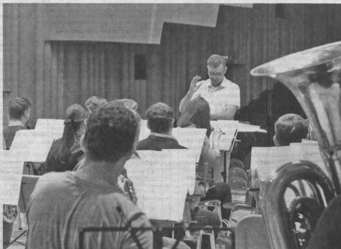
Музыканты недавно образованного Губернаторского духового оркестра во время репетиции.