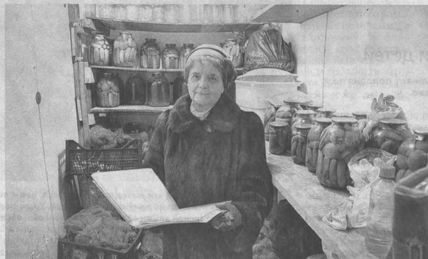
Свои огурчики и помидорчики для пенсионеров из «Радуги» – существенная строка экономики семейного бюджета.

У энергичного, неравнодушного и законопослушного председателя кооператива «Ра-