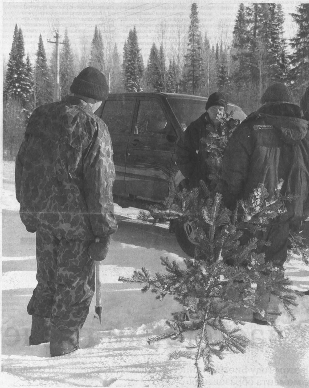
С начала нынешней операции «Ель» выявлено уже четыре случая ёлочного браконьерства.

В Кемеровской области полным ходом идет профилактическая операция «Ель», цель которой – предотвращение браконьерской вырубki хвойных деревьев к Новому году