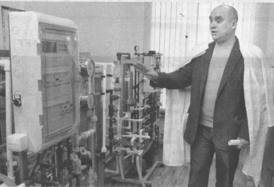
Производство ООО «Кемеровская фармацевтическая фабрика».

Институт ведет разработку транскатетерных биопротезов клапанов сердца. Эта технология позволяет внедрять малые инвазивные технологии проведения операции: их делают не на открытом сердце, а доставляют клапан с помощью транскатетерной технологии, что снижает риск операционной летальности. «Предприятие и создано для того,