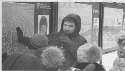
Полярный путешественник Матвей Шпаро.