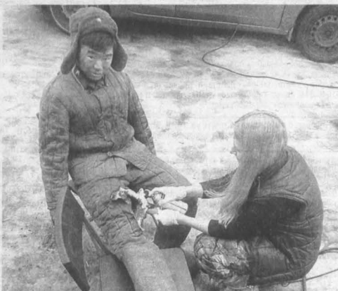
На съемках фильма «Двадцать восемь панфиловцев», премьера этого народного кино будет 24 ноября.

тех днях и хронику военных событий, воспоминаний военачальников, данные из полтора десятков фундаментальных научных трудов о битве под Москвой, хроника подвига дяди и его группы из 20 бойцов оказалась такова, — дает расклад племянник. — Его 112-я танковая дивизия была под Серпуховом. А немцы прорвались к Кашире. И то был трагический момент, поскольку дальнейшее продвижение немцев на Москву стало бы практически свободным... И тогда 112-ю дивизию отправили в Каширу. И пока шла передислокация и наши тяжелые танки ушли, то на прикрытии у железнодорожного моста остались пять танков и два броневика. В срочном созданной, сборной груп-