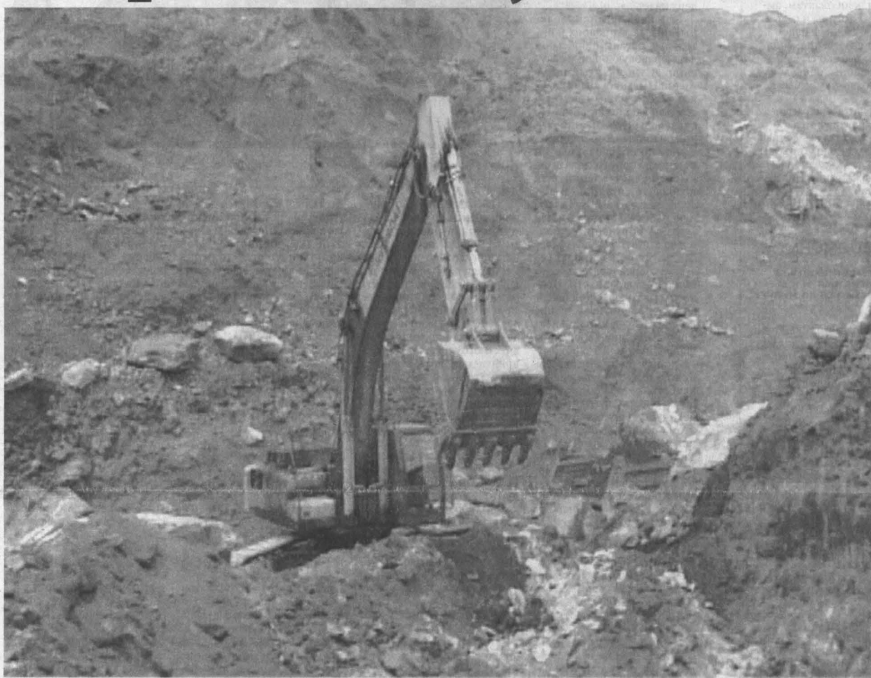
В Кузбассе активно борются с нарушителями природоохранного законодательства, и с «черными копателями». Такая позиция друзей не прибавляет...