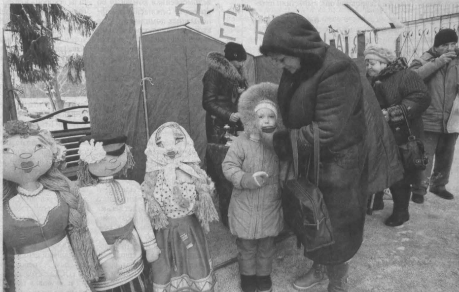
«ДЕНЬ ЧАЯ» – так назывался праздник, который прошел вчера на площади возле теруправления Заводского района Кемерова. Любый прохожий мог угоститься горячим напитком с бубликами-баранками и медом. Учитывая то, что рядом расположен губернский рынок, желающих согреться нашлось немало. В празднике приняли участие вокальные коллективы ветеранов района. В целом на сегодня в Кемерове уже работает губернаторская чайная в Сосновом бору, еще четыре откроется к 1 декабря и столько же – в дни зимних школьных каникул.