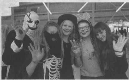
Новокузнецкие продемонстрировали изобретательность при изготовлении «страшных» одеяний.