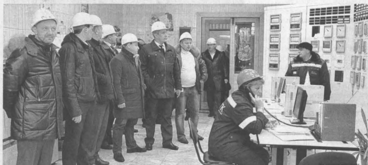
Во время экскурсии по станции. Химический цех.

В Кемерове в режиме когенерации работают Кемеровская ГРЭС и Ново-Кемеров-