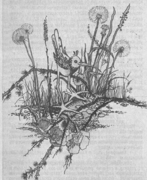
Работа Константина Эпова из серии «Шорох в траве».