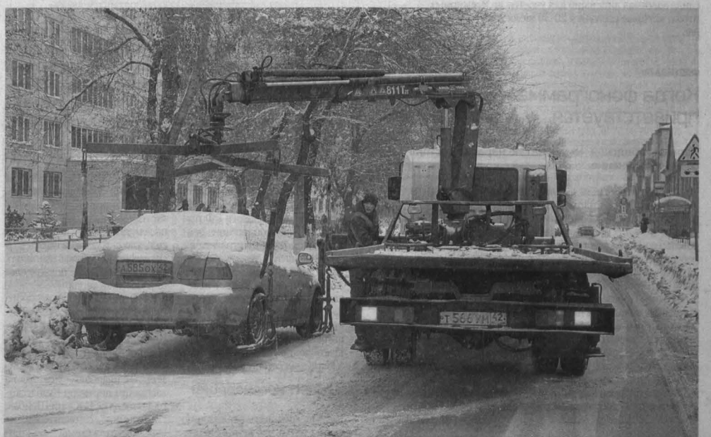
«ПОДСНЕЖНИКИ» ЗВАКУИРУЮТ. В Кемерове развернулась активная борьба с автомобилями, припаркованными в неположенных местах и мешающими уборке снега с дорог. Вчера во время рейда с дорог были вывезены авто, припаркованные на улице Дружбы. «Мы вынуждены пойти на жесткие меры. Ведь речь не только о чистоте улиц, но и о безопасности», — подчеркнул глава города Илья Середок. По прогнозам метеорологов, на этой неделе погода в регионе будет неустойчивой. Ожидается снег, мокрый снег, местами сильный, метели, гололедные явления. Так что эвакуация мешающих снегоуборке авто продолжится.