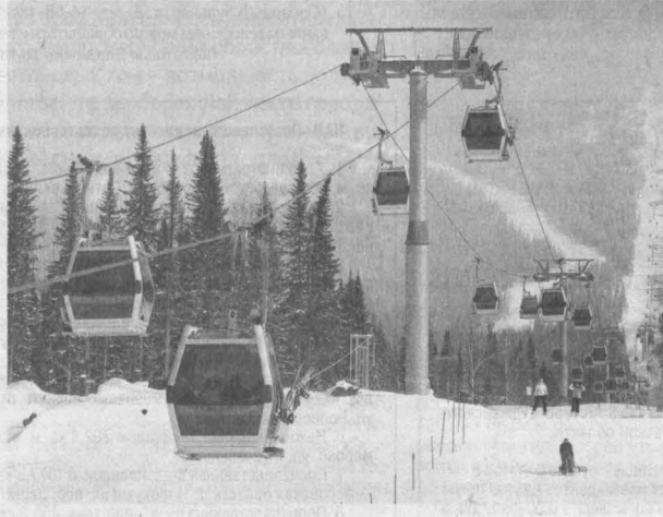
К выходным толщина снежного покрова на вершине горы Зеленой достигла 1,4 метра, а на Кургане и Мустаге – около двух.