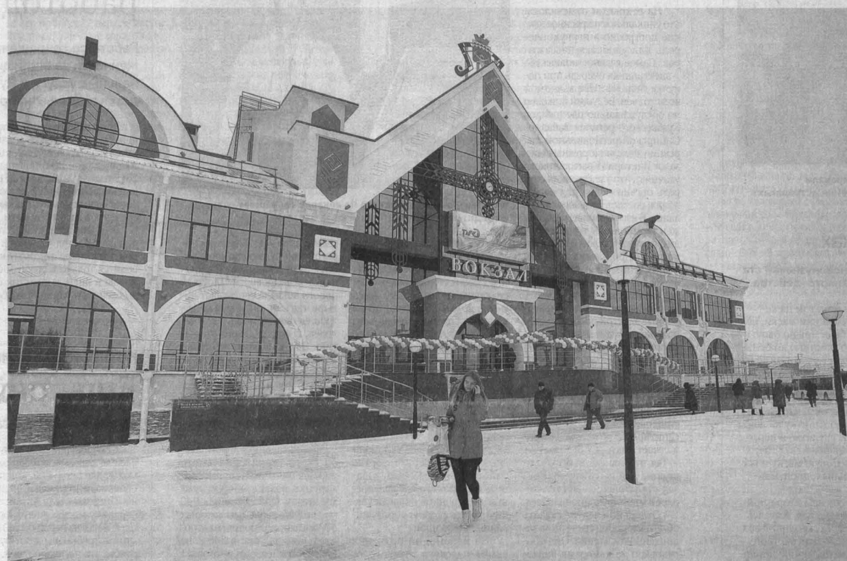
Интеллектуальный вокзал посылает новый архитектурный импульс всему городу Белово.

В Белове открыли второй в Кузбассе, после Новокузнецка, так называемый «умный» железнодорожный вокзал. В церемонии принял участие губернатор Аман Тулеев