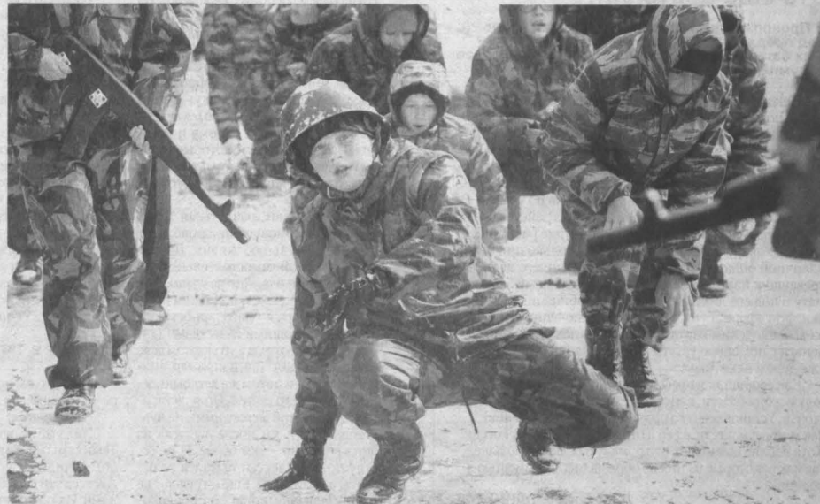
ПОСВЯЩЕНИЕ КУРСАНТОВ. В конце первой четверти в средней школе №14 Юрга восьмиклассники двух новых классов полиции, набранных с начала учебного года, прошли ритуал посвящения и стали полноправными курсантами. Почти 50 мальчишек и девчонок под бодрящие крики старших товарищей преодолели траншеи, горки, змейки и иные препятствия, построенные в школьном дворе по армейским образцам. Такое традиционное испытание на силу духа и физическую выносливость способствует выработке у подростков новых форм группового взаимодействия, коллективной сплоченности.