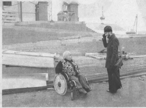
Новый храм Воскресения Христова возводится с пандусом, который пришлось делать многоуровневым, чтобы удобно было им пользоваться.