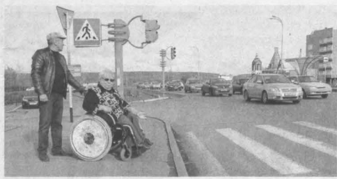
Очень много пешеходных переходов в Кемерове недоступны для инвалидов-колясочников, поскольку не оборудованы съездами на проезжую часть.