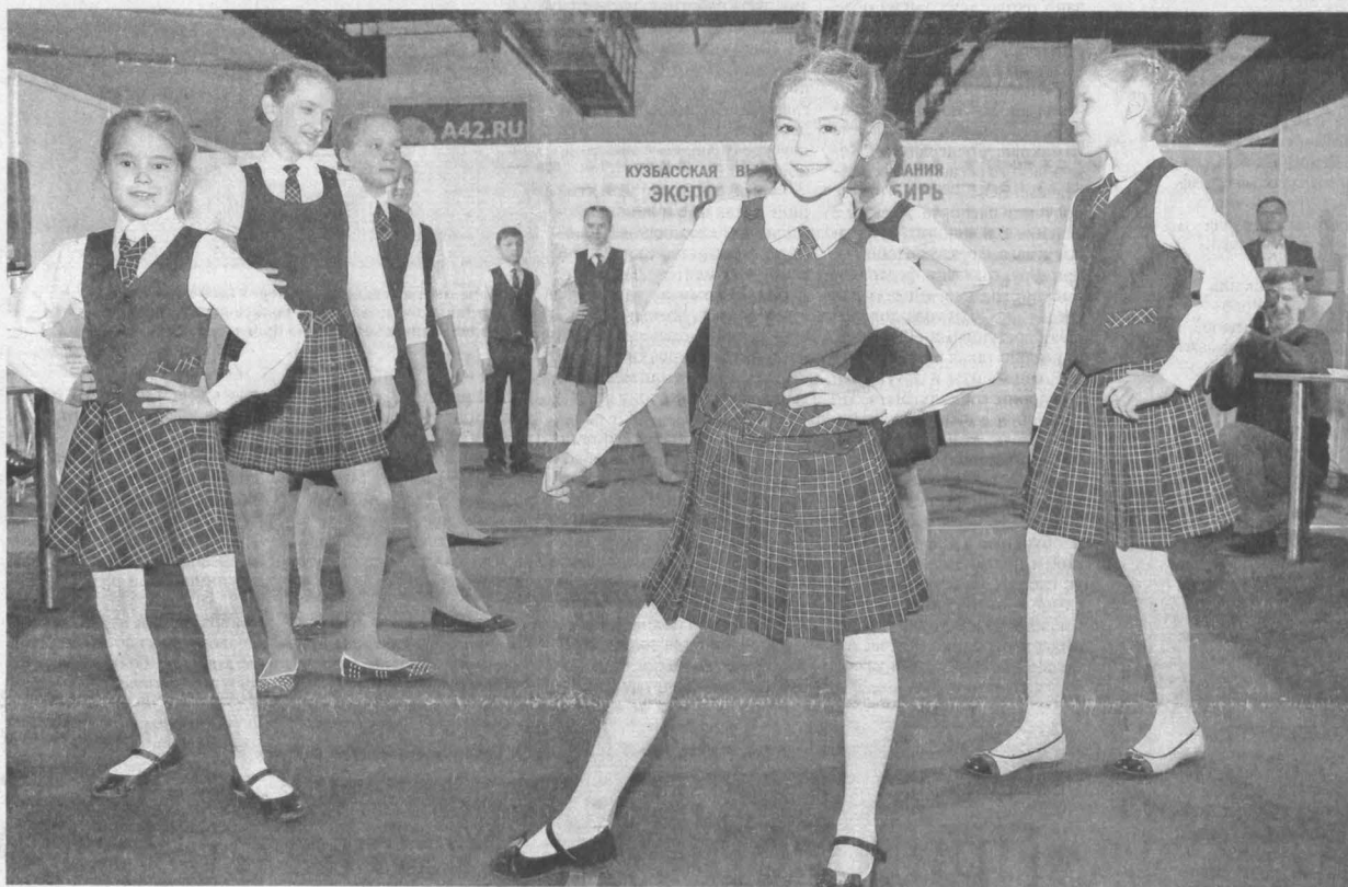
Производственные мощности кузбасских предприятий могут закрыть 100% рынка школьной формы. Цель на 2016 год – удержаться на докризисном уровне в 30%, надежда – к 2018-му выйти на 80%.

Производителей школьной формы поддержит правительство