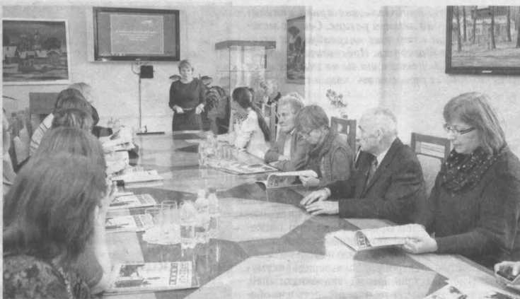
На презентации нового выпуска альманаха «Красная горка».

Идея о том, что у музея должен быть свой альманах, принадлежала известному кемеровскому поэту Геннадию Юрову, он и был бессменным