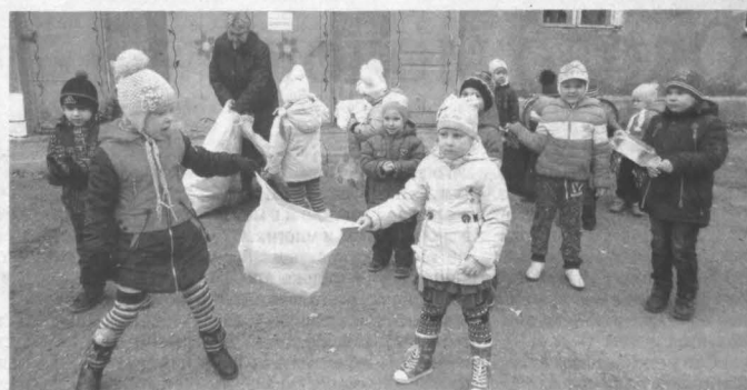
В районном центре Яшкино экологическую ответственность решили воспитывать смолу.