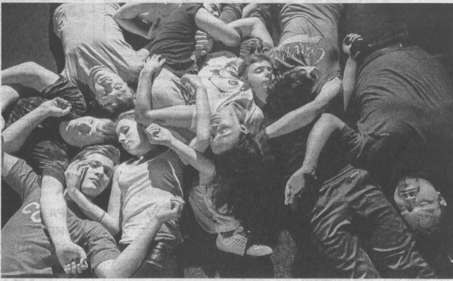
«Наш класс» рассказывает тяжёлый урок истории языком современной драмы.

Кемеровский «Наш класс» отмечен возрастным цензом +18. И хотя его герои не ругаются матом, а насилие выражено вербально и лишь подкреплено символическими жестами, на сцене по мере развития действия сгущается тяжелая атмосфера. Персонажи описывают свои