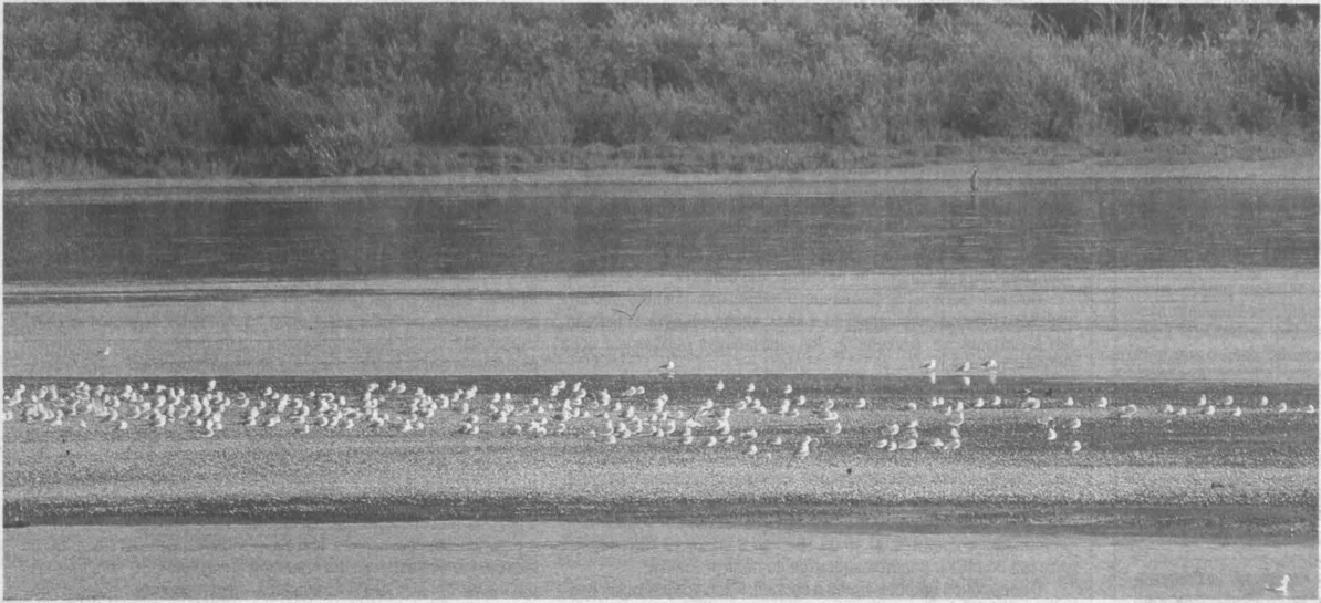
Снять одним кадром всю растянувшуюся стаю было сложно: часть птиц сидит на галечной косе, другая — на воде.