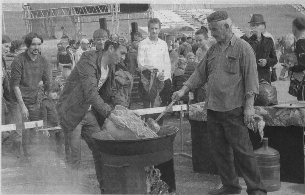
■ ВКУСНЫЙ ТУРНИР. На кемеровском стадионе «Химик» прошел второй «Кубок СССР» по летнему хоккею. В нем приняли участие команды различных национальных диаспор (подробнее об этом турнире газета «Кузбасс» расскажет в четверг). В рамках праздника прошел концерт с участием коллективов художественной самодеятельности и профессиональных артистов. Такие гости угощали сразу тремя разновидностями плова – узбекским, таджикским и азербайджанским, из которых два блюда готовились прямо на стадионе.