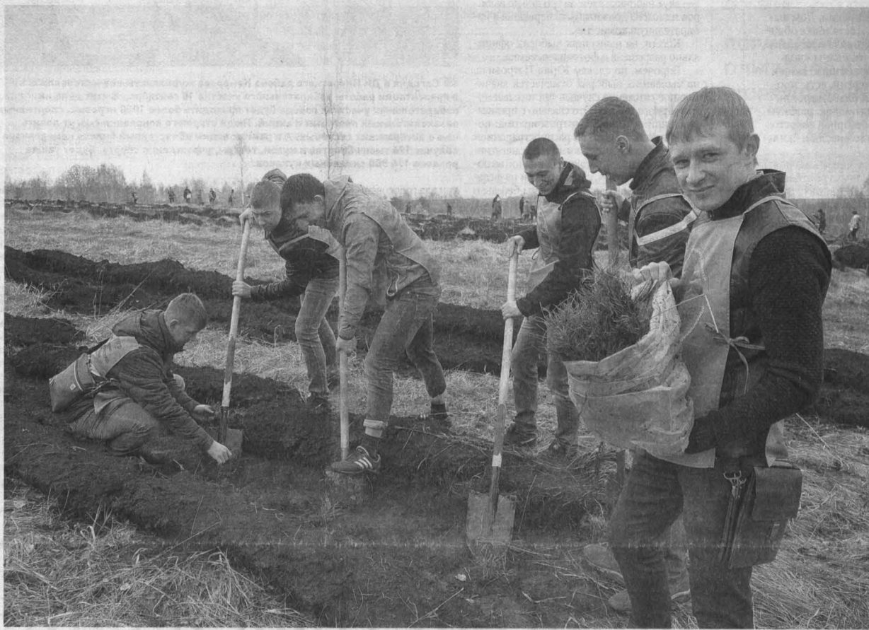
■ С начала всекузбасской акции «Подари свой лес потомкам» в Кемеровской области было посажено более 25 миллионов деревьев.

В течение нынешней осени в населенных пунктах Кузбасса появятся 69 памятных аллей в честь новых, только-только появившихся на свет жителей региона; они так и будут называться: Аллеи новорожденных. Заложат их по инициативе губернатора Амана Тулеева в рамках всероссийской акции «Живи, лес!». Так в Кемеровской области зародится еще одна добрая традиция – отмечать новым деревом появление на свет каждого нового человека.