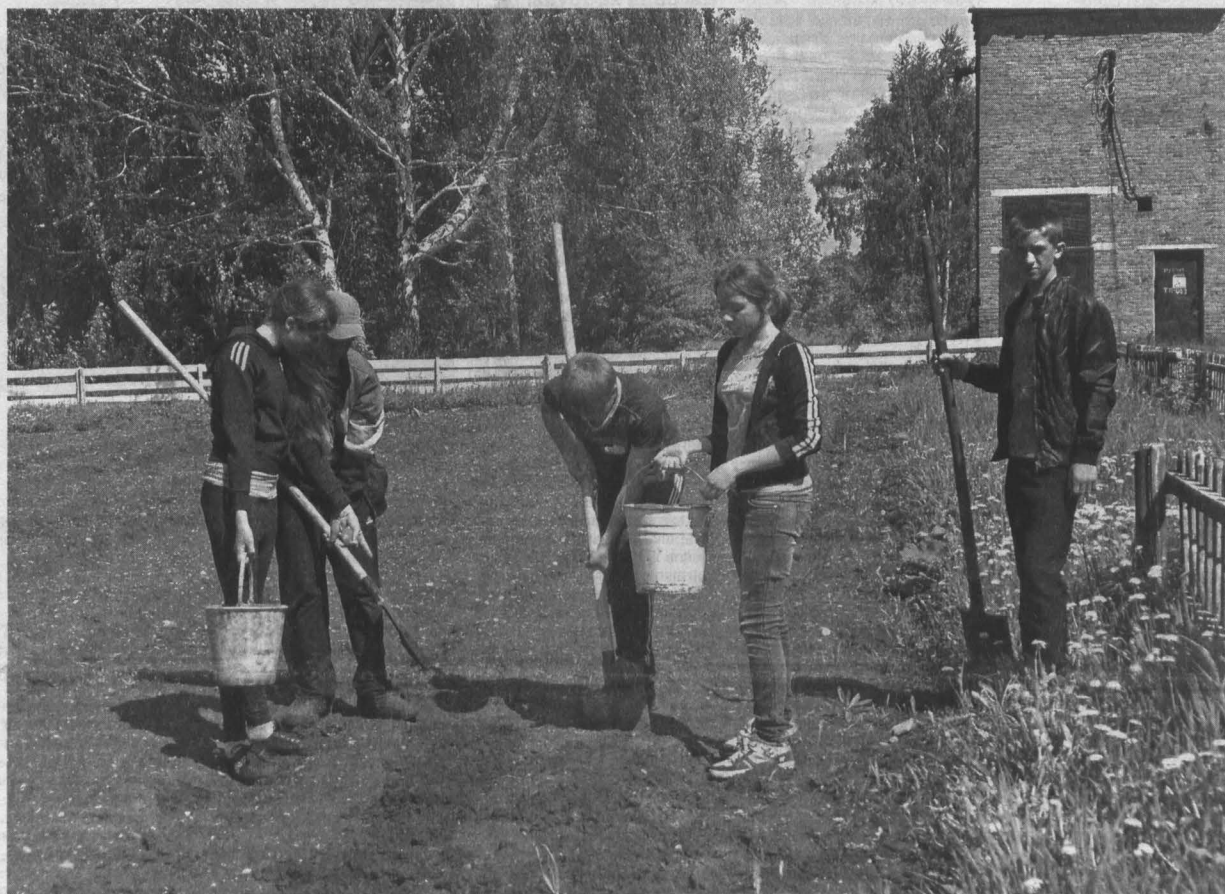
В дальнейшем юные исследователи планируют высаживать на своем опытном участке и изучать и другие сорта картофеля, кроме тех, которыми занимаются сейчас.

Новый сорт картошки «Кемеровчанин» попал под наблюдение сельской детворы