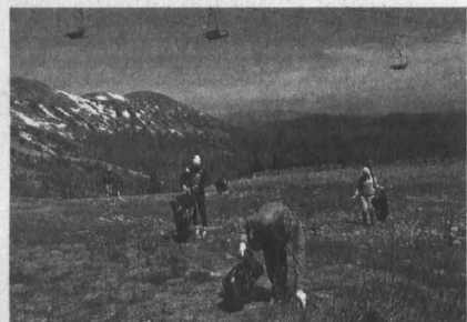
Уборка на горе Зеленой.