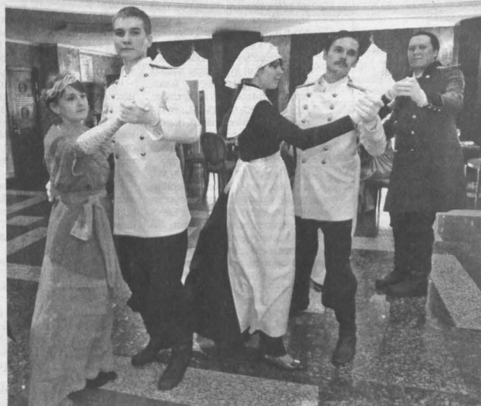
■ ОФИЦЕРСКИЙ БАЛ прошел в субботу в Кемерове, в Музыкальном театре им. А. Боброва. Играла классическая музыка, звучали стихи и романсы начала XX века. Пары кружились в вальсе. Гости могли взять уроки танцев, примерить элементы костюмов и сфотографироваться. В финале действия была представлена реконструкция сцен сражения времен Первой мировой войны. Стоит отметить, что это мероприятие — проект-победитель конкурса молодежных социально значимых проектов «Кемеровское молодое вече-2014» (в рамках реализации федерального проекта «Великая забытая война. 1914-1918»). Теперь его будут проводить регулярно.