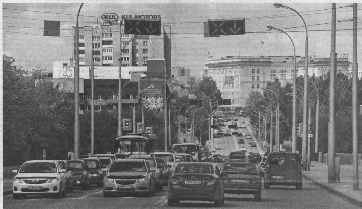
■ Реверсивное движение поможет разгрузить Университетский мост.

Со дня на день в Кемерове заработает участок дороги с реверсивным движением