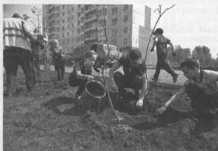
Посадка деревьев в Новокузнецке.