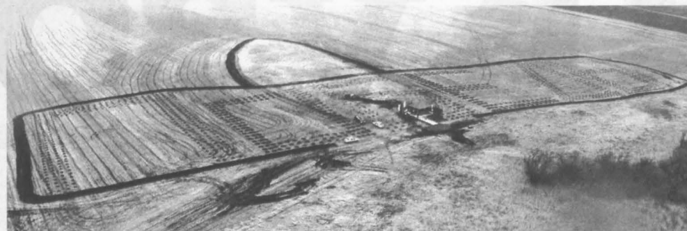
Окончательный вид геоглиф примет примерно через 10-15 лет.

Также в рамках Всероссийского дня посадки леса во всех регионах страны и ряде государств мира состоялась акция «Лес Победы». Организаторами было запланировано высадить 27 миллионов деревьев – по числу советских воинов, погибших в сражениях. Но это число может быть и превышено. Так, например, в память о 330 тысячах наших земляков, сражавшихся на фронтах Второй мировой, в Кемеровской области посадят почти 1,5 миллиона деревьев в специальных