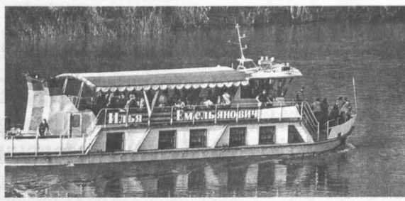
Внук построил корабль в память о деде-фронтовике и пустил его по Томи.