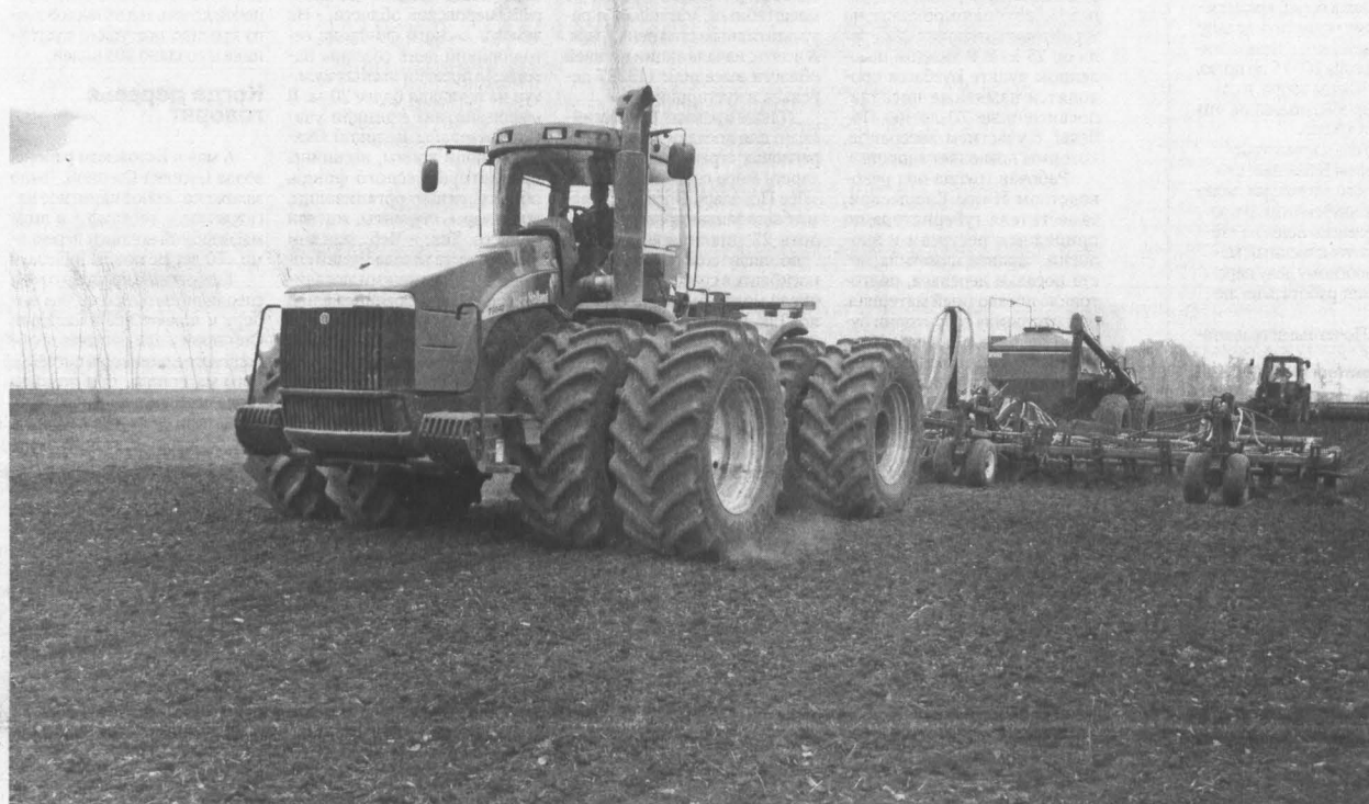
В поле весна, мир и труд.

Что происходит сегодня на кузбасских полях и над ними?